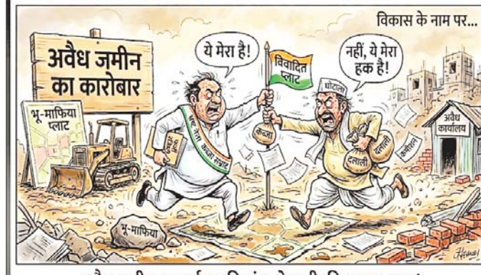
अवैध जमीन पर वर्चस्व की जंग: नेताजी की भागम-भाग!

जागरण, सीहोर। जिले की इछावर तहसील के गांवों में गरीबों को भरपूर उपाया के लिए दिए गए कृषि भूमि के पट्टे को हथियाने का खेल ब-दस्तूर बना हुआ है मजबूत का बात यह है कि पट्टों के इस खेल में भाजपा के दो कद्दावर नेताओं के बीच होड़ लगी हुई है कि कौन सबसे अधिक सरकारी पट्टे हथियाकर उन्हें अपने नाम कराने में सफल हो पाता है इन सबके बीच पट्टेधारियों की मौज दिखाई देने लगी है कि कौन नेता उनके पट्टों की अधिक से अधिक कीमत देकर उनकी जेब गर्म कर सकता है।