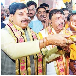
प्रधानमंत्री मोदी के 12 साल का कार्यकाल पूर्ण होने के उपलक्ष्य में भोपाल सहित प्रदेश भर के मंदिरों में पूजा अर्चना के कार्यक्रम आहुत किए गए।

विशेष संवाददाता, भोपाल। प्रधानमंत्री नरेंद्र मोदी के कार्यकाल के 12 साल पूरे होने पर बुधवार को राजधानी भोपाल में धार्मिक कार्यक्रम हुए। इनमें मुख्यमंत्री डॉ. मोहन यादव सहित दूसरे भाजपा नेता मौजूद रहे। इस मौके पर सीएम ने कहा कि पिछले 12 सालों में देश के भीतर जनसेवा और सीमा पर सामरिक सुरक्षा सशक्त हुई है। सीएम ने कहा कि देश के 25 करोड़ लोगों को मकान दिलवाए गए हैं, तो 80 करोड़ नागरिकों को निःशुल्क अनाज वितरित किया जा रहा है। प्रधानमंत्री मोदी के नेतृत्व में करोड़ों लोग गरीबी रेखा से बाहर निकलकर सम्मानपूर्वक जीवनयापन कर रहे हैं। डॉ. यादव ने कहा कि हम जो कहते हैं वो करके दिखाते हैं। प्रधानमंत्री मोदी ने भारत की आजादी के बाद निर्वाचित रूप से सबसे अधिक अवधि तक देशसेवा करने का रिकॉर्ड आज अपने नाम किया है। वे दुनिया के सबसे बड़े लोकतंत्र के नायक हैं, जिन्होंने प्रधानमंत्री के रूप में सर्वाधिक लंबे समय तक कार्य किया है।