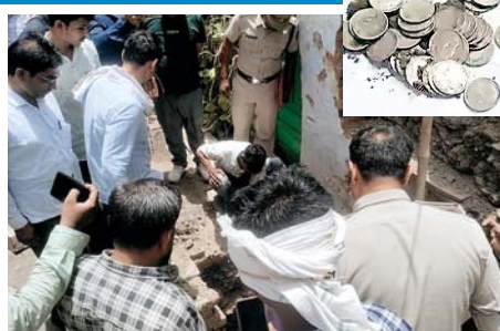
पुलिस और प्रशासन ने की कार्रवाई

जागरण, दमोह। प्रदेश के दमोह जिले के फुटेरा वार्ड क्रमांक 3 में उस समय हड़कंप मच गया जब एक मकान के निर्माण कार्य के दौरान पिलर की खुदाई में बड़ी मात्रा में चांदी के सिक्के मिलने का दावा हुआ। मजदूरों के अनुसार, मिट्टी खोदते समय पहले एक पीतल का कलश मिला, जिसमें एक चांदी का सिक्का था। इसके बाद आगे की खुदाई में और सिक्के तथा चांदी की रॉड मिलने की बात कही गई। मजदूरों का दावा है कि कुल मिलाकर करीब 35 किलो से अधिक चांदी के सिक्के निकले थे। मामलों में उस समय विवाद खड़ा हो गया जब मजदूरों ने मिलने वाले खजाने में हिस्सेदारी की मांग की। आरोप है कि उन्हें केवल 500 रुपए देकर वहां से हटा दिया और बाद में मकान मालिक ने सभी सिक्कों को बाल्टी में भरकर अपने पास रख लिया। इसके बाद नाराज मजदूरों ने गांव पहुंचकर पूर्व सरपंच के सामने सिक्कों का सारा भेद खोल दिया। पूर्व सरपंच ने पुलिस को मामले की जानकारी दी। मजदूरों का कहना है कि उन्हें उचित हिरसा नहीं दिया गया, जिसके कारण विवाद बढ़ गया।