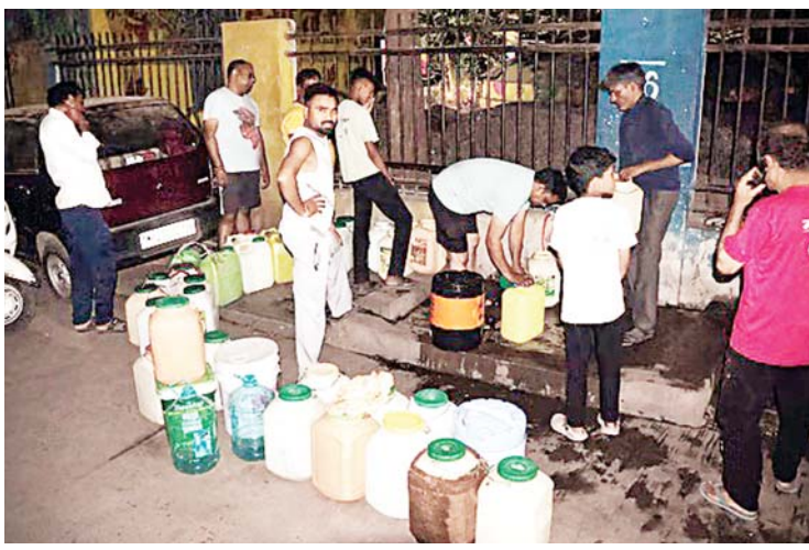
दिन में नौकरी, रात में टंकी पर पानी के लिए लाइन

जागरण, इंदौर। प्रदेश में भीषण गर्मी के साथ जलसंकट भी बढ़ता जा रहा है। समस्या अंचल से निकलकर बड़े शहरों तक पहुंच गई है। प्रदेश की आर्थिक राजधानी इंदौर और रतलाम में जलसंकट से आक्रांशित लोगों का गुस्सा सड़कों पर दिखा। इंदौर के कई इलाकों में रविवार को पानी की समस्या को लेकर प्रदर्शन और चक्काजाम किए गए। पालदा क्षेत्र में रहवासियों ने सड़क पर उतरकर प्रदर्शन किया। देखते ही देखते लोग उग्र हो गए और सड़क पर वाहनों को रोककर चक्काजाम कर दिया। स्थिति को संभालने के लिए पुलिस अधिकारियों को मौके पर पहुंचना पड़ा। प्रदर्शन कर रहे लोगों का कहना था कि घरों में पानी पूरी तरह खत्म हो चुका है और नगर निगम उनकी समस्याओं पर ध्यान नहीं दे रहा। मजबूरी में उन्हें विरोध-प्रदर्शन का रास्ता अपनाना पड़ रहा है।