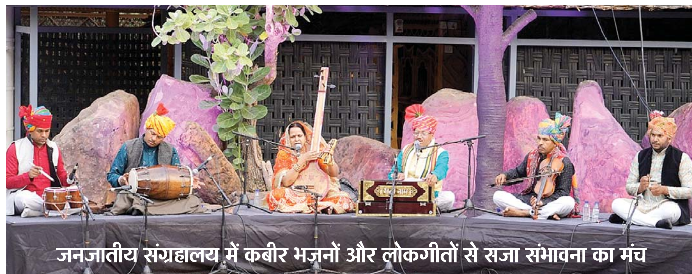
जनजातीय संग्रहालय में कबीर भजनों और लोकगीतों से सजा संभावना का मंच