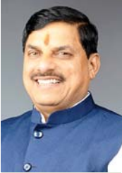
डॉ. मोहन यादव

भारतीय संस्कृति और हिंदू धर्म में नदियों को मात्र जल स्रोत नहीं, बल्कि देवी के रूप में पूजा जाता है। गंगा दशहरा या गंगावतरण ज्येष्ठ मास के शुक्ल पक्ष की दशमी तिथि को मनाया जाने वाला प्रमुख त्यौहार है। पृथ्वी पर गंगा के अवतरण की स्मृति में मनाया जाने वाला गंगा दशहरा जल के प्रति कृतज्ञता का पर्व है।