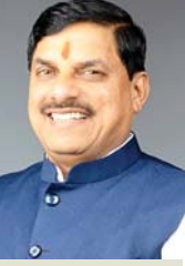
डॉ. मोहन यादव

भारतीय संस्कृति और हिंदू धर्म में नदियों को मात्र जल स्रोत नहीं, बल्कि देवी के रूप में पूजा जाता है। गंगा दशहरा या गंगावतरण ज्येष्ठ मास के शुक्ल पक्ष की दशमी तिथि को मनाया जाने वाला प्रमुख त्यौहार है। पृथ्वी पर गंगा के अवतरण की स्मृति में मनाया जाने वाला गंगा दशहरा जल के प्रति कृतज्ञता का पर्व है।