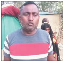
अतरैला थाना क्षेत्र का मामला पीड़ित ने कार्रवाई के लिए लगाई गुहार

जागरण, रीवा। अतरैला थाना क्षेत्र में जबरन कब्जे और दबंगों का मामला सामने आया है। पीड़ित ने अपने लै घर पर दबंगों द्वारा कब्जा करने की कोशिश और हरे-भरे पेड़ों की कटाई सहित जान से मारने की धमकी जैसे गंभीर आरोप