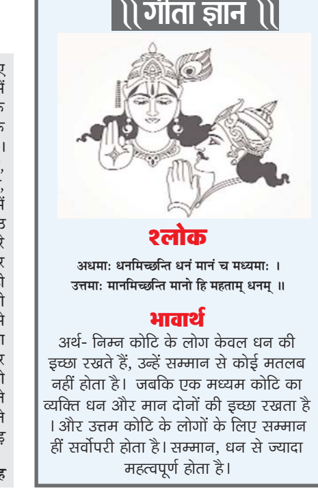
अर्थ- निम्न कोटि के लोग केवल धन की इच्छा रखते हैं, जबकि सम्मान से कोई मतलब नहीं होता है। उर्वक एक मध्यम कोटि का व्यक्ति धन और मान दोनों की इच्छा रखता है । और उत्तम कोटि के लोगों के लिए सम्मान ही सर्वोपरी होता है। सम्मान, धन से ज्यादा महत्वपूर्ण होता है।

सुप्रीम कोर्ट का यह हस्तक्षेप लोकतंत्र की जीवंतता और व्यक्तिगत स्वतंत्रता के संरक्षण का प्रतीक है। ‘तारीख पर तारीख’ के फिल्मी संवाद को हकीकत में बदलने के लिए प्रशासनिक जटिलताओं को खत्म करना और ‘जेल नहीं, जमानत’ के सिद्धांत को धरातल पर उतारना अनिवार्य है। यदि हम स्वचालित प्रणालियां और जवाबदेह कार्यशील को अपनाने हैं, तो न्याय का रथ तारीखों के बोझ से मुक्त होकर मानवीय गरिमा और स्वतंत्र तर्क के पथ पर अग्रसर होगा। यह केवल एक आदेश नहीं, बल्कि भारतीय न्याय प्रणाली के पुनरुद्धार का एक महा-संकल्प है।