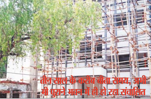
तीन साल के करीब बीता समय, अभी भी पूरने काम में ही हो रहा संचालित

जागरण, रिवा। जय स्तंभ चौराहे के समीप मप्र गृह निर्माण कार्यालय के सामने केन्द्रीय पुस्तकालय भवन का निर्माण गृह निर्माण मण्डल द्वारा ही करवाया जा रहा है, जिसके निर्माण को लगभग 3 वर्ष होने को आया किन्तु भवन अभी तक पूर्ण नहीं हुआ, कार्य तो चल रहा है किन्तु बहुत ही मंद गति से पूर्व में कई-कई दिनों तक यहां कार्य बंद ही रहता था, बताते हैं शुरुआत में ठेकेदार द्वारा निर्माण कार्य रोक दिया गया था इतना ही नहीं मजदूरों को भी उसके द्वारा भुगतान नहीं किया गया था, जिससे काफी समय तक यहां का कार्य बंद रहा, इसके पश्चात फिर से कार्य रोक दिया गया, बताया जाता है उस दौरान यहां खर्च की जाने वाली राशि किसी अन्य कार्य में खर्च कर दी गई थी। इसके बाद कार्य शुरू हुआ, जो कभी चालू रहता है तो कभी बंद रहता है। जिससे भवन अभी भी अपूर्ण ही है। केन्द्रीय पुस्तकालय पुराने भवन में ही संचालित किया जा रहा है, जिसमें पाठकों के बैठने के लिए पर्याप्त स्थान नहीं है, जितने पाठक अंदर आ जाते हैं उन्हें बैठा दिया जाता है, बाकी चक्कर काटते रहते हैं, कहने को यहां पाठकों के साथ विद्यार्थियों के लिए कम्प्यूटर वगैरह भी आए हैं, किन्तु ऑपरटर के अभाव में कम्प्यूटर पड़े धूल खा रहे हैं, लंबे समय से यहां प्रभावी का अभाव रहा है, कर्मचारियों की कमी है, गत वर्ष पाठ्य-पुस्तकें भी नहीं आईं, जिसके चलते पुस्तकालय का संचालन प्रभावित हो गया, भवन बनने के बाद भी इसका संचालन बेहतर हो पाएगा अथवा नहीं, फिलहाल कहना मुश्किल है।