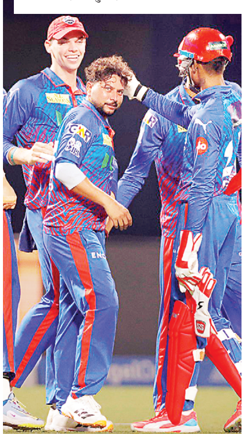
100 छक्के दिल्ली के कप्तान अक्षर पटेल के आईपीएल में पूरे हो गए।