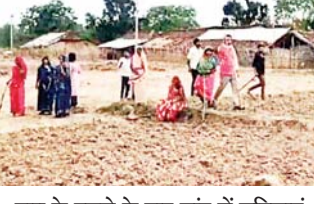
बाघ के हमले के बाद गांव में महिलाएं लाठियां लेकर निगरानी करते हुए।