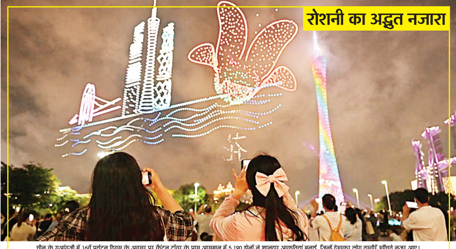
चीन के गुआंगजौ में 16वें पर्यटन दिवस के अवसर पर कैंटन टॉवर के पास आसमान में 5,190 ड्रॉनों ने शानदार आकर्षण बनाई, जिन्हें देखकर लोग तस्वीरें खींचते नजर आए।