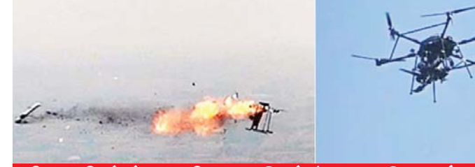
डीआरडीओ ने भारतीय कंपनियों के साथ किया तैयार

नई दिल्ली, जेएनएन। भारत की डिफेंस रिसर्च एंड डेवलपमेंट ऑर्गनाइजेशन डीआरडीओ ने ड्रोन से दागी जाने वाली मिसाइल का ट्रायल पूरा कर लिया है। इस मिसाइल का नाम यूएलपीजीएम-वी3 है। यह हवा से हवा और हवा से जमीन दोनों तरह के टारगेट पर सटीक हमला कर सकती है। हवा में दुश्मन के हेलिकॉप्टर, ड्रोन और दूसरे हवाई टारगेट को मार गिरा सकती है। वहीं जमीन पर टैंक, सैन्य वाहन और बंकर को निशाना बना सकती है। रक्षा मंत्रालय के मुताबिक, मिसाइल का परीक्षण आंध्र प्रदेश के कुर्नूल स्थित डीआरडीओ टेस्ट रेंज में किया गया।