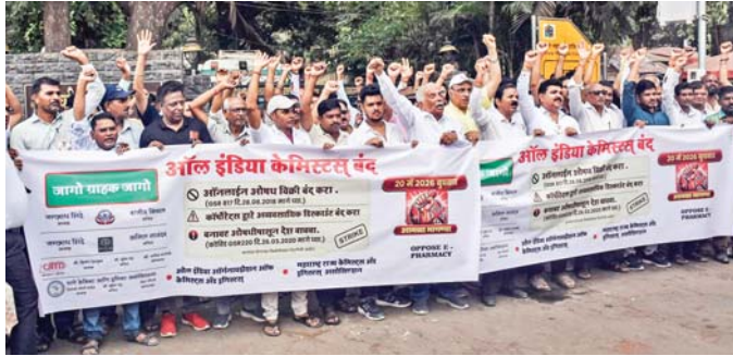
ठाणे में बुधवार को ऑनलाइन दवा बिक्री के विरोध में दवा और औषधि दुकानों के मालिकों ने एक दिवसीय हड़ताल की और दुकानें बंद रहीं।

नई दिल्ली, जेएनएन। दवाओं की ऑनलाइन बिक्री और बड़ी कंपनियों के कॉमिटीशन के विरोध में बुधवार को देशभर के 15 लाख से ज्यादा मेडिकल स्टोर बंद हैं। ऑल इंडिया ऑर्गनाइजेशन ऑफ केमिस्ट्स एंड ड्रुगिस्ट्स एआईओसीडी ने एक दिन की हड़ताल का ऐलान किया है। बंद का मामूली असर दिख रहा है। पटना के आईजीआईएमएस के बाहर मरीज और उनके परिवार वाले दवाओं के लिए परेशान दिखे। वहीं, चंडीगढ़ के पीजीआई में इलाज कराने आए कश्मीर के एक परिवार को भी दवाई नहीं मिल सकी। उसने कहा, 'दवाई नहीं मिल रही हैं।' हालांकि, एआईओसीडी ने कहा था कि बंद के दौरान भी अस्पतालों से जुड़े मेडिकल स्टोर खुले रहेंगे। इमरजेंसी दवाओं की सप्लाई में कोई रुकावट नहीं आने दी जाएगी।