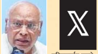
मल्लिकार्जुन खड्गे काजिस अय्यय

मोदी सरकार में पिछले 11 वर्षों में प्रत्येक भारतीय पर औसत कर्ज 11 गुना बढ़ गया है, जबकि अरबपतियों की कुल संपत्ति 97.50 लाख करोड़ रुपए से अधिक हो गई है। घरेलू एलपीजी की कीमत 121 प्रतिशत बढ़ गई है, जो 2014 में 414 रुपए से बढ़कर 2026 में 915.5 रुपए हो गई है। मार्च, 2026 में युवा बेरोजगारी (15 से 29 वर्ष की आयु) बढ़कर 15.2 प्रतिशत हो गई है, जो नौ महीने की चरम सीमा पर है। यह गहराते आर्थिक संकट को दर्शाती है।