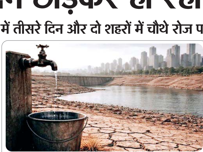
प्रदेश के नगरीय निकायों में जलापूर्ति का लेखा-जोखा

मुख्य संवाददाता, भोपाल। प्रदेश में गर्मी के तीखे तेवरों के दौर में जल संकट गहरा गया है। सूबे के चालीस फीसदी शहरों में अब रोजाना जलापूर्ति पर ब्रेक लग गया है। इनमें से दस शहर ऐसे हैं जहां हर दो दिन और दो शहरों में तीन दिन के अंतराल पर आपूर्ति की जा रही है। प्रदेश में कुल 413 नगरीय निकाय हैं, इनमें 16 नगर निगम, 99 नगर पालिका और 298 नगर परिषद हैं। इसके अलावा एमपी में 5 कैट बोर्ड भी हैं, जिनकी देखरेख नगरीय प्रशासन विभाग द्वारा की जाती है। जानकारी के अनुसार प्रदेश के 413 नगरीय निकायों में अब केवल 241 में ही रोजाना वाटर सप्लाई हो पा रही है। 162 नगरीय निकायों में फिलहाल एक दिन छोड़कर पानी की आपूर्ति की जा रही है।