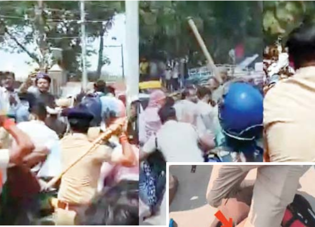
वैकेंसी जारी करने की मांग को लेकर पटना कॉलेज से निकले थे। अभ्यर्थी बीपीएससी ऑफिस तक मार्च निकाल रहे थे।

पटना, जेएनएन। पटना में शुक्रवार को टीआरई-4 अभ्यर्थियों पर पुलिस ने लाठीचार्ज कर दिया। कैडिडेट्स को सड़कों पर दौड़ा-दौड़ाकर पीटा गया। इस दौरान कई के सिर फटे हैं। महिला अभ्यर्थी को पुलिस वालों ने पैरों से कुचला। अभ्यर्थी ने कहा, 'हम आने वाले भविष्य के टीएचर हैं। ये लोग हमें गुंडा समझ कर पीट रहे हैं।' लाठीचार्ज के बाद सड़कों पर अभ्यर्थियों की चपलों बिखरी दिखीं। एक कैडिडेट के कपड़े सीने तक खून से सने थे। लाठीचार्ज के बाद कैडिडेट्स ने आधे कपड़े उतार दिए और सड़क पर बैठकर नारेबाजी करने लगे। बारिश के बीच अभ्यर्थी सड़क पर डटे हैं। अभ्यर्थियों की मांग है कि सरकार आज ही टीआरई-4 की वैकेंसी जारी करे। शुक्रवार सुबह 10 बजे अभ्यर्थियों ने