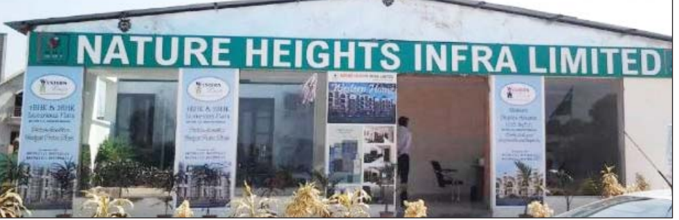
प्राइम लोकेशन पर सस्ते प्लॉट का झांसा

मुख्य संवाददाता, भोपाल। मध्य प्रदेश और पंजाब के हजारों मध्यमवर्गीय परिवारों को सस्ते प्लॉट और दुकानों का सपना दिखाकर करोड़ों की चपत लगाने वाली कंपनी नेचर हाइट्स इन्फ्रा लिमिटेड पर शकंजा कस गया है। प्रवर्तन निदेशालय (ईडी) की जांच में साफ हो गया है कि कंपनी ने निवेश के नाम पर करीब 51 करोड़ रुपये की हेराफेरी की है। इस मामले में अब विशेष अदालत ने कुर्क की गई संपत्तियों में से लगभग 20.21 करोड़ रुपये की प्रॉपर्टी बैंकों को वापस करने का आदेश दिया था, ताकि कुर्क की भरपाई की जा सके। ईडी से मिली जानकारी के अनुसार फिलहाल ईडी ने इस कंपनी की 46 करोड़ की संपत्ति को जब्त कर रखा है, जिसका बाजार भाव अब लगभग 100 करोड़ हो गया है। कोर्ट ने अपने फैसले में यह भी कहा है कि बैंक लोन चुकाने के बाद शेष बची रकम और प्रॉपर्टी से एमपी और पंजाब के उन लोगों को भुगतान भी किया जाएगा जिनके साथ कंपनी ने धोखाधड़ी की है।