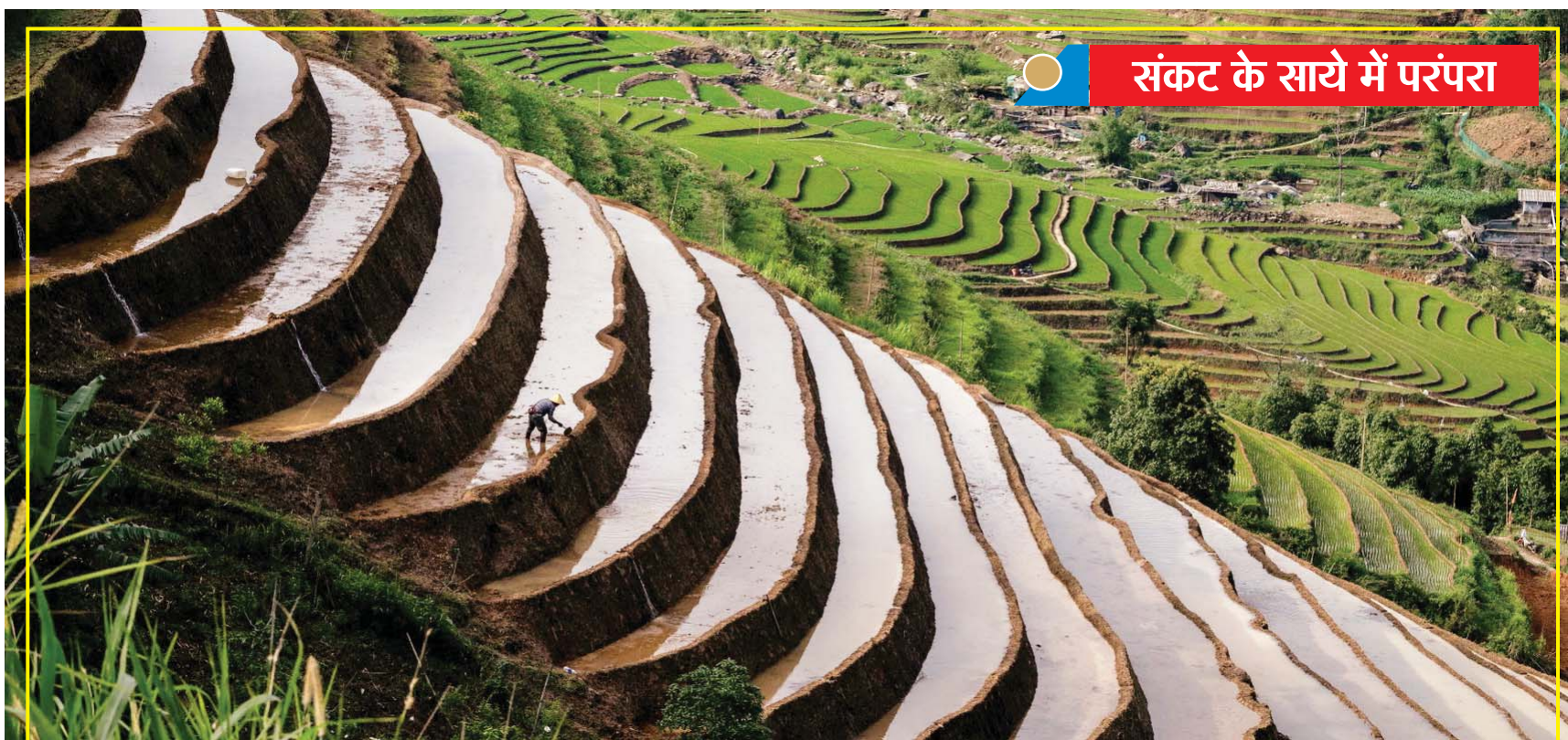
विवतनाम: सापा की पहलियों में रेड दाओं समुदाय के किसान चावल के सीजन की तैयारी कर रहे हैं। विवतनाम के इन खूबसूरत खेतों तक भी अब ईरान युद्ध की तपिश पहुंच चुकी है, जहाँ ईरान और ऊंची खाद की कोमलों ने रोपाईं के सीजन को और अधिक खर्चीला बना दिया है, जिससे स्थानीय किसान परेशान हैं। यहां पारंपरिक ढंग से ही धान रोपा जाता है। आने वाले समय में यदि युद्ध जारी रहता है तो यहां संकट और गहराएगा।

बाद सम्राट सरकार में कुल मंत्रियों की संख्या 34 हो गई है। मुख्यमंत्री और दो उपमुख्यमंत्री पहले ही शपथ ले चुके थे।