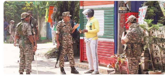
पश्चिम बंगाल में जिला मुख्यालय समेत कई अन्य स्थानों पर केंद्रीय बल तैनात है।