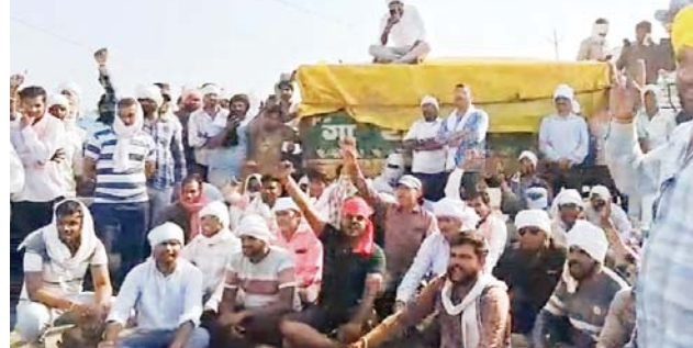
गुना : कलेक्ट्रेट में किसानों का हंगामा, गेट के कांच फूटे

जागरण, हरदा/गुना/विदिशा। प्रदेश में अव्यवस्थाओं को लेकर किसानों का आक्रोश भड़क रहा है। बुधवार को हरदा में गेहूँ खरीदी के दौरान अचानक तुलाई रुकने पर किसान भड़क गए। गुना में खाद की किल्लत पर कलेक्ट्रेट में किसानों का आक्रोश दिखा तो विदिशा जिले में चने और मसूर की तुलाई में देरी होने पर किसानों का सन्न जवाब दे गया। हरदा में समर्थन मूल्य पर गेहूँ खरीदी के दौरान अव्यवस्थाओं को लेकर किसानों ने हरदा-खंडवा स्टेट हाईवे पर ट्रैक्टर-ट्रॉली खड़े कर चक्काजाम कर दिया। विवाद पलासनेर स्थित अमृता वेयरहाउस उपार्जन केंद्र से शुरू हुआ। यहां भंडारण क्षमता पूरी होने का हवाला देकर अचानक गेहूँ की तुलाई रोक दी। इसके बाद किसानों को दूसरे वेयरहाउस शिफ्ट होने का निर्देश दिया, जिससे वह भड़क गए और हाईवे पर आवागमन ठप कर दिया। प्रदर्शन कर रहे किसानों का आरोप था कि प्रशासन उन्हें संस्कृति वेयरहाउस भेज रहा है, जबकि वहां भी भंडारण की पर्याप्त जगह नहीं है और अव्यवस्थाएँ हैं। किसानों का कहना है कि बार-बार केंद्रों के चक्कर काटने से उन्हें आर्थिक नुकसान और मानसिक परेशानी का सामना करना पड़ रहा है।