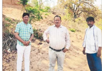
सोन नदी पर बालू माफियाओं का रिजिस्टर्ड वेनकाब, सफेदपोशों की छत्रछाया में अवैध कारोबार चरम पर