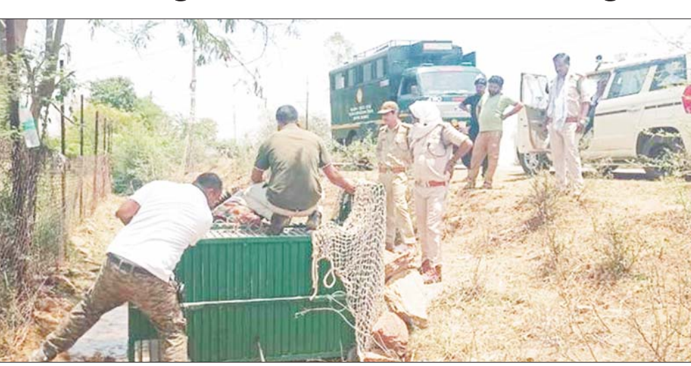
गए, जिनमें पानी के प्रवाह, कंटेनर झाड़ियों आदि का उपयोग शामिल रहा। अंततः पाइप के व्यास के अनुकूल

जागरण, पन्ना। अमानगंज बफर रेंज के समीप दक्षिण पन्ना वनमण्डल की पवई रेंज के राजस्व क्षेत्र अंतर्गत हिनौती ग्राम में एक तेंदुआ देखा गया। आकार कुत्ते का पीछा करते हुए तेंदुआ एक संकरे पाइप में प्रवेश कर गया। स्थानीय ग्रामीणों ने पाइप के दोनों सिरों को पत्थरों से बंद कर वन विभाग को सूचना दी। सूचना मिलते ही दक्षिण पन्ना वनमण्डल का मैदानी अमला एवं पन्ना टाइगर रिजर्व की रेस्क्यू टीम तत्काल मौके पर पहुंचे। पाइप के एक सिरे पर सुरक्षित पकड़ के लिए ट्रैप केज लगाया गया तथा दूसरे सिरे को पूरी तरह बंद किया गया। तेंदुए को केज की दिशा में ले जाने के लिए विभिन्न उपाय अपनाए