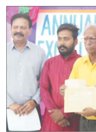
कक्षा में प्रथम स्थान एवं विषय विशेष में सर्वोत्तम अंक प्राप्त करने वाले मेधावी विद्यार्थियों को पुरस्कार देकर सम्मानित किया। इसमें कक्षा में प्रथम, द्वितीय व तृतीय स्थान प्राप्त करने वाले सभी विद्यार्थियों को पुरस्कृत किया गया एवं विभिन्न गतिविधियों में उत्कृष्ट प्रदर्शन के