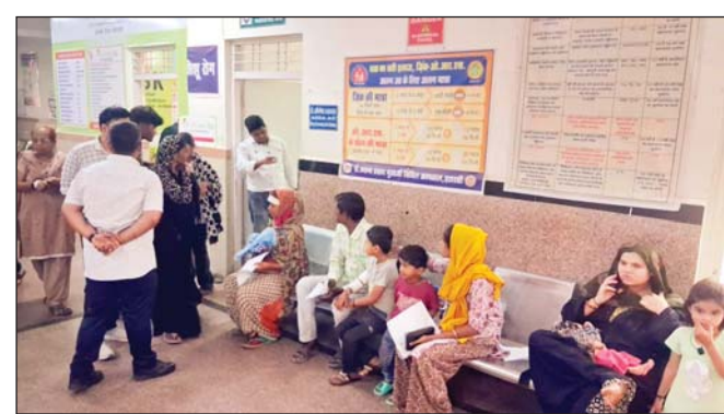
लू के लिए बना 'डैडिकेटेड वार्ड', 80 फीसद केस गर्मी जनित

जागरण, इटारसी। मई की शुरुआत के साथ ही समूचा नर्मदापुरम जिला भीषण लू की चपेट में आ गया है। आसमान से बरसती आग ने आम जनजीवन की रफतार थाम दी है। स्थिति की गंभीरता को देखते हुए जिला प्रशासन ने 'ऑरेंज अलर्ट' जारी किया है। गर्मी का सबसे भयानक असर स्वास्थ्य सेवाओं पर पड़ रहा है। डॉ. श्यामा प्रसाद मुखर्जी (सिविल) अस्पताल में इन दिनों मरीजों का भारी हुजूम उमड़ रहा है, जिससे स्वास्थ्य व्यवस्थाएं चरमरा गई हैं। हालांकि अभी दो दिन से हवाओं ने तापमान में कुछ गिरावट दर्ज की है, लेकिन धूप का तीखापन अब भी चुभ रहा है।