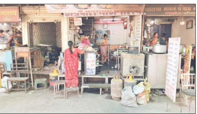
इसकी कीमत 936.50 रुपये हो गई है। 19 किलो के साथ-साथ 5 किलो वाले एफटीएल छोटे सिलेंडर में भी 261 रुपये की वृद्धि हुई है, जिसके बाद

सिलेंडर खरीदना उनके बस के बाहर होता जा रहा है। ऐसी स्थिति में कई छोटे खान-पान संचालकों के सामने अपना व्यवसाय बंद करने की नौबत आ गई है। संचालकों के मुताबिक, महंगाई का बोझ अब उनके पारंपरिक व्यवसाय पर इतना अधिक बढ़ गया है कि आर्थिक स्थिति पूरी तरह डगमगा गई है। कोयला भट्टी की ओर लौटने को मजबूर महंगाई से त्रस्त कुछ संचालकों का कहना है कि यदि कीमतें इसी तरह बढ़ती रहें, तो वे गैस छोड़कर वापस पुराने दौर की तरह कोयला भट्टी पर