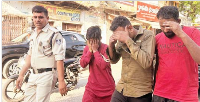
जागरण, सागर। पुलिस ने गौवंश के मामले में कार्यवाही करते हुए तीन शातिर बदमाशों को गिरफ्तार कर लिया है। यह शातिर तरीके से गौवंश चोरी करके ले गए थे। एक मामले में वीडियो भी वायरल हुआ था।