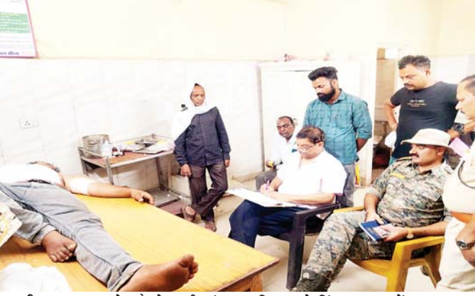
बीना जागरण। क्षेत्र के देवराजी गांव में गवाही को लेकर शुरू हुआ विवाद

शनिवार को हिंसक घटना में बदल गया। पुरानी रंजिश के चलते आरोपियों ने एक