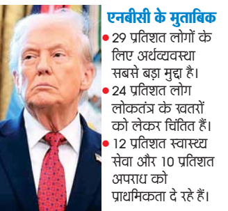
एनबीसी के मुताबिक

वॉशिंगटन, जेएनएन। अमेरिका में होने वाले मध्यावधि चुनावों में अब केवल छह महीने का समय शेष है, लेकिन इस बीच राष्ट्रपति डोनाल्ड ट्रंप के लिए बुरी खबरें सामने आ रही हैं। हालिया ओपिनियन पॉल्स (मतदान सर्वेक्षण) के अनुसार, अर्थव्यवस्था, अप्रवासन और ईरान संघर्ष जैसे प्रमुख मुद्दों पर ट्रंप के प्रबंधन से जनता का भरोसा कम होता दिख रहा है। यह गिरावट न केवल ट्रंप के बल्कि उनके जुड़े रिपब्लिकन उम्मीदवारों के लिए भी एक बड़ी चुनौती बन सकती है। ऐतिहासिक निचले स्तर पर पहुंची अप्रवृत्त रेटिंग: रॉयटर्स-इंफोस, स्ट्रेंथ और एपी-एनओआरसी द्वारा किए गए तीन अलग-अलग सर्वेक्षणों में राष्ट्रपति ट्रंप की अप्रवृत्त रेटिंग 33 प्रतिशत से 36 प्रतिशत के बीच दर्ज की गई। यह उनके कार्यकाल के सबसे निचले स्तर पर है।