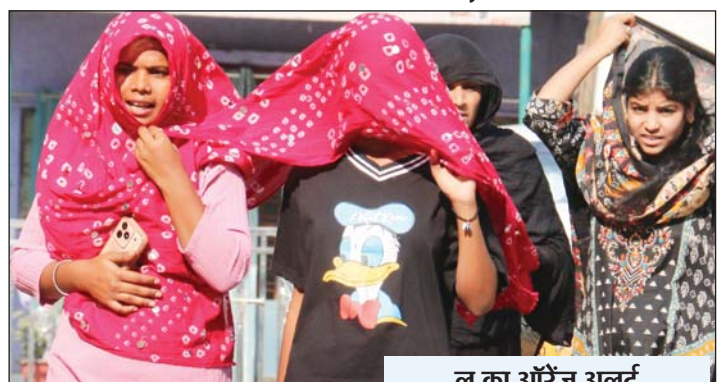
लू का ऑरेंज अलर्ट

मुख्य संवाददाता, भोपाल। राजधानी भोपाल समेत पूरे मध्य प्रदेश में अब सूरज की तपिश लोगों को बेहाल करने वाली है। मौसम विज्ञान केंद्र के अनुसार, प्रदेश के ऊपर से गुजर रही ट्रफ लाइन का असर खत्म हो गया है, जिसके चलते गुरुवार से आसमान पूरी तरह साफ हो जाएगा। बादलों के छंटते ही सूरज की सीधी किरणें धरती पर पड़ेंगी, जिससे तापमान में 3 से 4 डिग्री तक का बढ़ा उछाल आने की उम्मीद है। बुधवार को भोपाल में अधिकतम तापमान 40.6 डिग्री और न्यूनतम 24.0 डिग्री दर्ज किया गया। बादलों की मौजूदगी और 10 से 12 किमी प्रति घंटे की रफ्तार से चली हवा के कारण थोड़ी राहत थी, लेकिन अब गुरुवार से तीखी धूप तपन बढ़ाएगी। नर्मदापुरम और खजुराहो सबसे गर्म: प्रदेश में गर्मी के तेवर अभी से तीखे हैं। बुधवार को नर्मदापुरम और छतरपुर का खजुराहो 43.0 डिग्री के