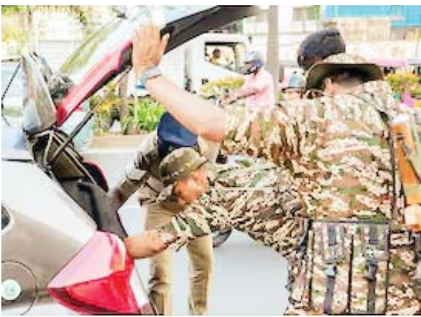
तमिलनाडु विधानसभा चुनाव से पहले चेन्नई में एक कार को जांच करते सीआरपीएफ के जवान।

खरगे को आयोग का नोटिस नई दिल्ली, जेएनएन। चुनाव आयोग ने कांग्रेस अध्यक्ष मल्लिकार्जुन खरगे को प्रधामंत्री नरेंद्र मोदी पर दिए गए विवादित आतंकवादी बयान को लेकर नोटिस जारी किया है। आयोग ने इसे आचार संहिता का उल्लंघन मानते हुए 24 घंटे के भीतर जवाब तलब किया है। चुनाव आयोग की इस कार्रवाई पर कांग्रेस ने कहा कि चुनाव आयोग केंद्र सरकार का संलग्न कार्यालय है।