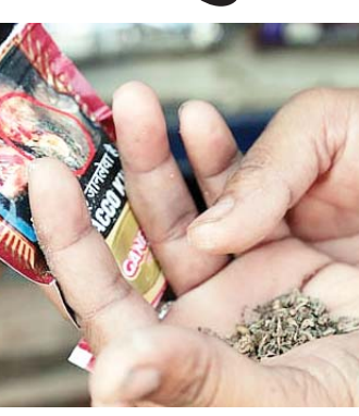
तंबाकू मुक्त बनाने के लिए बेहतर कदम