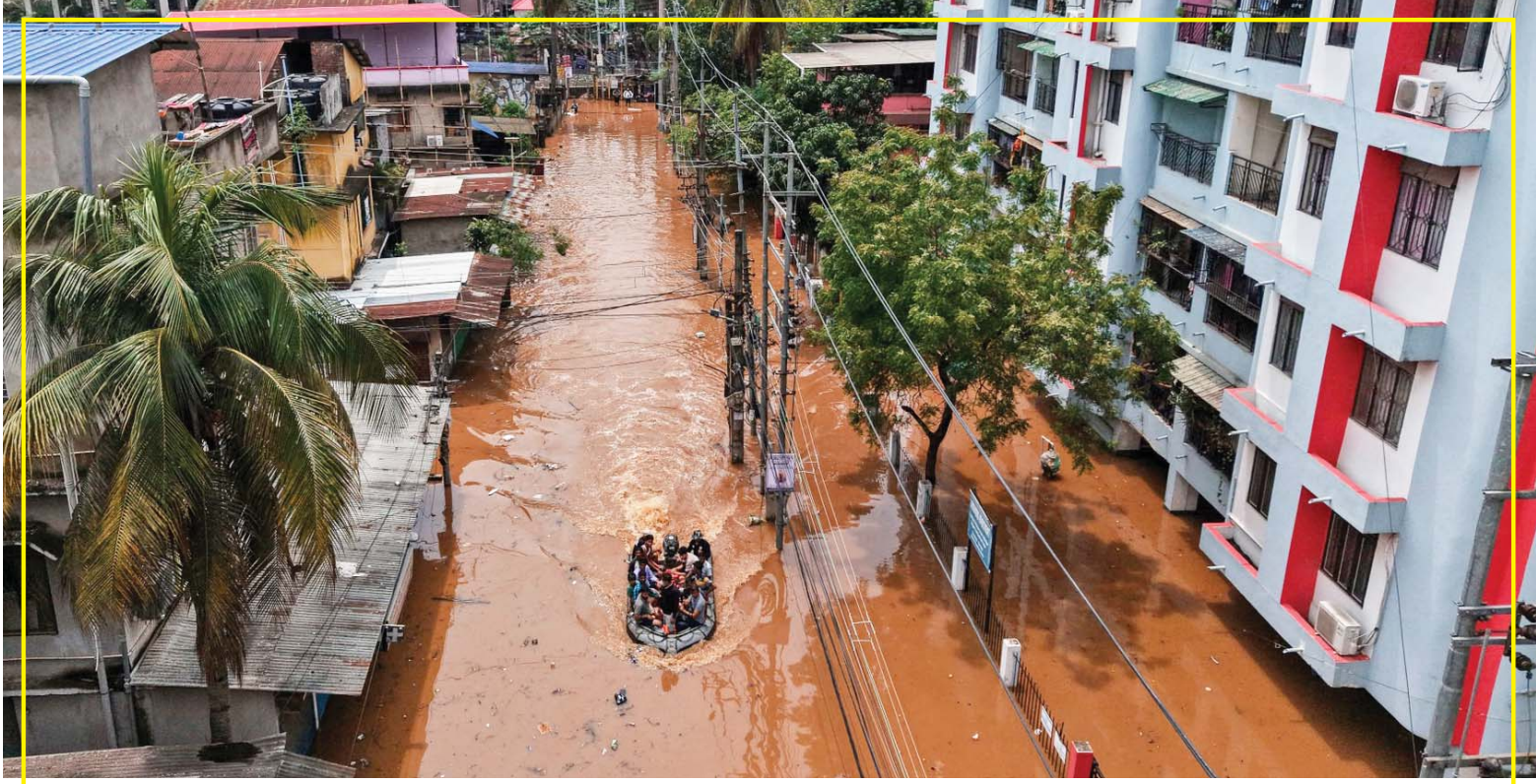
कई राज्यों में तापमान ४५ डिग्री सेल्सियस से ऊपर पहुंचने से गर्मी चरम पर है। वहीं उत्तर-पूर्वी राज्य असम के गुवाहाटी में प्री-मॉनसून के दौरान भारी बारिश से प्रभावित लोगों की मदद के लिए स्टेट डिजास्टर रिस्पॉन्स फोर्स को उतारना पड़ा। गुवाहाटी में बाढ़ वाली सड़क पार करती रेस्क्यू बोट।

नई दिल्ली, जेएनएन। कांग्रेस पार्टी ने मंगलवार को देश के 29 शहरों में प्रेस कॉन्फ्रेंस आयोजित करने का निर्णय लिया है। इस अभियान के जरिए पार्टी महिला आरक्षण और परिसीमन के मुद्दों पर केंद्र सरकार को घेरेगी। कांग्रेस की मांग है कि महिला आरक्षण को किसी भी शर्त के बिना, वर्तमान 543 सीटों के आधार पर तुरंत लागू किया जाए। पार्टी ने सरकार पर आरोप लगाया है कि वह महिला आरक्षण की आड़ में 'विभाजनकारी परिसीमन' की शर्तें थोप रही हैं, जो कि एक 'राजनीतिक हथियार' है। कांग्रेस नेताओं का कहना है कि सरकार लोकसभा की सीटें 543 से बढ़ाकर 816 या 850 करने की योजना बना रही है, जो लोकतंत्र के लिए हानिकारक हो सकती है। पार्टी का तर्क है कि जनसंख्या आधारित परिसीमन से दक्षिण भारतीय राज्यों का प्रतिनिधित्व कम हो जाएगा, जिससे क्षेत्रीय संतुलन बिगड़ सकता है। यह कदम 17 अप्रैल को लोकसभा में परिसीमन और महिला आरक्षण से जुड़े 131वें संविधान संशोधन विधेयक के गिर जाने के बाद उठाया गया है, जिसे विधायी गठबंधन ने मिलकर विफल कर दिया था।