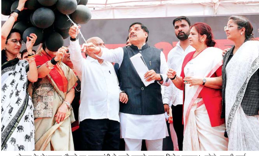
भोपाल के रोशनपुरा चौराहे पर मुख्यमंत्री ने काले गुब्बारे उड़ाकर विरोध जताया।