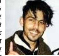
फेक पासपोर्ट बनवाने के बाद देश से भागा अब सऊदी में छिपा