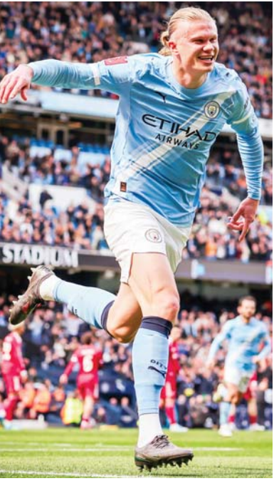
■ हालैंड का यह लीग में 23वां गोल है और वह इस प्रतियोगिता के मौजूदा सत्र में सर्वाधिक गोल करने वाले खिलाड़ी हैं।

स्तर स्ट्राइकर एलिंग हालैंड के दूसरे हाफ में किए गए गोल की मदद से मैनचेस्टर सिटी ने आर्सेनल को 2-1 से हराकर प्रीमियर लीग (ईपीएल) फुटबॉल टूर्नामेंट में खिताब की दौड़ को रोमांचक बना दिया है। इस जीत से इस सिटी के 32 मैच में 67 अंक हो गए हैं, जबकि शीर्ष पर काबिज आर्सेनल के 33 मैच में 70 अंक हैं। तीसरे और चौथे नंबर पर काबिज मैनचेस्टर यूनाइटेड और एस्टन विला के समान 58 अंक हैं। मैनचेस्टर सिटी को बुधवार को रेलीगेशन के खतरे से जूझ रही वर्नली के खिलाफ मैच खेलना है और संभावना है कि पेप गाडियोला की टीम इस मैच में जीत हासिल करके आर्सेनल की बराबरी पर पहुंच जाएगी और पांच दौर के मैच शेष रहते हुए बढ़त हासिल कर लेगी। हालैंड ने 65वें मिनट में गोल किया, जबकि रायन चेर्की ने 16वें मिनट में सिटी को बढ़त दिलाई, लेकिन आर्सेनल ने दो मिनट बाद ही काई हावटर्ज के गोल से बराबरी कर दी थी।