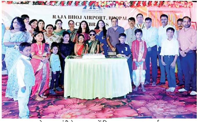
आम्बेडकर जयंती के उपलक्ष्य में विमान तल पर हुआ कार्यक्रम

एयरपोर्ट पर अंबेडकर जयंती के उपलक्ष्य में कार्यक्रम