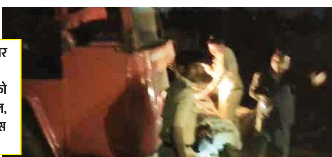
स्थानीय लोग और पुलिस ने किया रेस्क्यू, घायलों को पहुंचाया अस्पताल, छोला मंदिर पुलिस जांच में जुटी

क्राइम रिपोर्टर, भोपाल। छोला मंदिर इलाके में शनिवार-रविवार की दरम्यानी रात तेज रफ्तार एलपीजी गैस से भरा टैंकर झुगगी बस्ती में घुस गया। दीवार तोड़कर घर से अंदर घुसे टैंकर की चपेट में आने से 7 साल की मासूम बच्ची की मौके पर ही मौत हो गई। करीब एक घंटे तक वह पहिए के नीचे दबी रही। माता-पिता समेत चार लोग घायल हो गए। घटना के वक्त सभी सो रहे थे। बस्ती में अफरा-तफरी मच गई। दो और मकान क्षतिग्रस्त हो गए। चालक वाहन छोड़कर मौके से भाग निकला। स्थानीय लोग और पुलिस ने रेस्क्यू कर घायलों को अस्पताल पहुंचाया। पुलिस ने वाहन जब्त कर चालक को तलाश शुरू कर दी है।