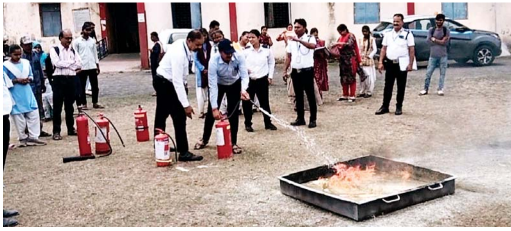
पहली बार एयरपोर्ट से बाहर निकलकर सरकारी स्कूल में पहुंचा अग्निशमन स्टाफ।

हिरदाराम नगर प्रतिनिधि। वैसे तो 300 मीटर की सबसे कम दृष्टता में भी विमानों की आसान लैंडिंग एवं यात्री सुविधाओं के विस्तार के मामले में राजधानी भोपाल का एयरपोर्ट देश में अवल दर्जे का बन गया है, जिसका अंदाजा इसी बात से लगाया जा सकता है कि पिछले 6 माह की अवधि के सर्वे में वह एक बार फिर नम्बर वन पर अपना नाम दर्ज कराया है, लेकिन राजा भोज विमान तल पर प्रदेश ही नहीं मध्य भारत का पहला अत्याधुनिक फायर स्टेशन बना है, जिसे अब आम जनता तक पहुंचाने की कवायद प्रारंभ हो गई है, ताकि उसे पता चल सके कि किस तरह से आग बुझाई जा सकती है, और आवश्यकता पड़ने पर कम से कम राजधानी भोपाल के नागरिक इस फायर स्टेशन का भी इस्तेमाल कर सकते हैं, ताकि आग के दौरान किसी भी अनहोनी को आसानी से दबाने में मदद मिले।