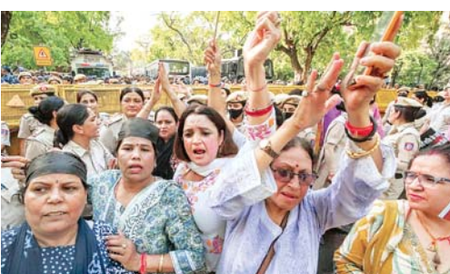
शिवसेना महिला विंग का प्रदर्शन: लोकसभा में संविधान (131वां संशोधन) विधेयक के पारित न होने पर दिल्ली में भाजपा कार्यकर्ताओं ने सड़क पर प्रदर्शन किया।