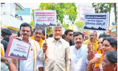
विधेयक के गिरने के विरोध में आंध्र प्रदेश सीएम चंद्रबाबू नायडू ने निदावली में प्रदर्शन किया। इसमें टीडीपी, जन सेना और भाजपा दलों के नेताओं व कार्यकर्ता भी शामिल हुए।

आर्टिफिशियल इंटेलिजेंस और एल्गोरिदम के जरिए ब्रेन स्कैन का विश्लेषण करने से पता चलता है कि मानसिक बीमारियों में न्यूरॉन्स की सक्रियता का एक विशेष पैटर्न होता है, जिसे कृत्रिम तंत्रिका नेटवर्क द्वारा पहचाना जा सकता है। यानी ये तकनीक न केवल मस्तिष्क की नकल करती है, बल्कि मस्तिष्क की गतिविधियों को सक्रिय रूप से ट्रिगर और मॉड्यूलेट भी कर सकती हैं।