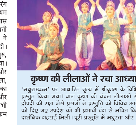
कृष्ण की लीलाओं ने रचा आध्यात्मिक वातावरण 'मधुराक्षक' पर आधारित नृत्य में श्रेष्ठ के विभिन्न रूपों को भावपूर्ण ढंग से प्रस्तुत किया गया। बाल कृष्ण की चंचल लीलाओं से लेकर गोवर्धन धारण और द्रौपदी की रक्षा जैसे प्रसंगों ने प्रस्तुति को विविध आयाम दिए। कुशक्षेत्र में अर्जुन को दिए गए उपदेश को भी प्रभावशील ढंग से मंचित किया गया, जिससे प्रस्तुति को दार्शनिक गहराई मिली। पूरी प्रस्तुति में मधुरता और भावों की निरंतरता बनी रही।

जागरण, भोपाल। रवीन्द्र भवन में आयोजित 'नृत्य रंजिनी 2026' में पखरंग नृत्य अकादमी की छात्राओं ने भरतनाट्यम की सजीव प्रस्तुतियों से कार्यक्रम को खास बना दिया। आयोजन की शुरुआत सरस्वती वंदना से हुई, जिसमें नवप्रवेशी छात्राओं ने सरल भावों के साथ अपनी प्रस्तुति दी। इसके बाद पुष्पांजलि ने नृत्यांगनाओं ने गुरु, मंच और दर्शकों के प्रति आदर व्यक्त किया। जतिस्वरम् में ताल-लय की जटिलता और संतुलन का सुंदर मेल देखने को मिला, जबकि मंगलम् ने पूरे वातावरण में शांति का भाव उत्पन्न किया। गणेश वंदना में भाव और भक्ति का संतुलित प्रदर्शन रहा। अंत में सभी छात्राओं की सामूहिक प्रस्तुति ने कार्यक्रम को प्रभावशाली समापन दिया।