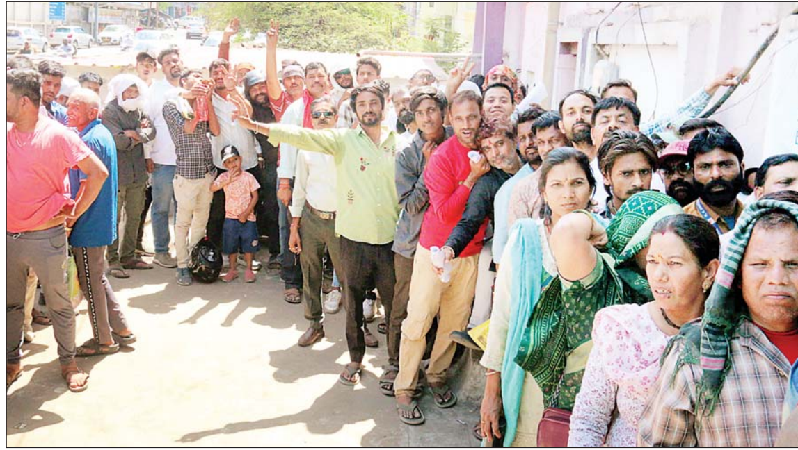
राजधानी से बाबा अमरनाथ के दर्शन करने जाने वालों में उत्साह नजर आ रहा है। न्यू मार्केट स्थित पंजाब नेशनल बैंक में फार्म भरने के लिए भक्तों की भीड़ उमड़ रही है। वहीं जेपी अस्पताल में भी जांच कराने बड़ी संख्या में लोग पहुंच रहे हैं।