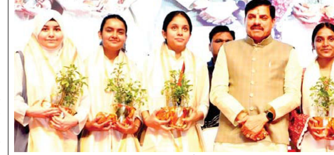
सीएम ने रविंद्र भवन में 'नारी शक्ति वंदन कार्यक्रम - प्रबुद्ध जन सम्मेलन' में 10वीं और 12वीं बोर्ड की टॉपर बालिकाओं को सम्मानित किया।