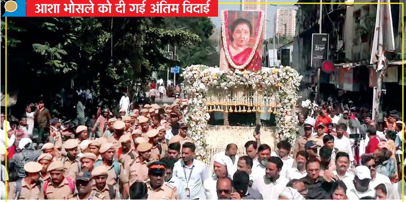
सिंगर आशा भोसले का राजकीय सम्मान के साथ शिवाजी पार्क रमशान घाट पर अंतिम संस्कार हुआ। उन्हें महाराष्ट्र पुलिस ने गार्ड ऑफ ऑनर दिया। बॉलीवुड सिंगर्स ने उनका गाना 'अभी ना जाओ छोड़कर' गाकर विदाई दी। सोमवार सुबह उनका पार्थिव शरीर अंतिम दर्शन के लिए उनके मुंबई स्थित उनके निवास कासा ग्रांड में रखा गया था। उन्हें तिरंगे में लपेटकर सलामी भी दी गई।