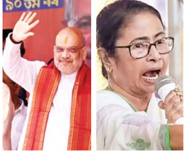
गृह मंत्री अमित शाह ने सोमवार को पश्चिम बंगाल के बीरभूम में जनसभा की।

नई दिल्ली/कोलकाता, जेएनएन। गृह मंत्री अमित शाह ने सोमवार को पश्चिम बंगाल के बीरभूम में जनसभा की। उन्होंने कहा कि ममता दीदी कहती हैं कि महिलाओं को शाम 7 बजे के बाद घर से बाहर नहीं निकलना चाहिए। उन्हें शर्म आनी चाहिए। हमारी सरकार आएगी तो बच्चियों रात 1 बजे भी बाहर निकल पाएंगी। टीएमसी सरकार पर भ्रष्टाचार का आरोप लगाते हुए उन्होंने कहा कि कैश फॉर क्रैरी, 26 हजार शिक्षकों की भर्ती, गाय तस्करी और पीएम आवास में टीएमसी ने घोटाले किए। इन घोटालों में बंगाल की जनता के 5000 करोड़ रुपए गायब हो गए। हमारी सरकार बनते ही हम टीएमसी से पाई-पाई का हिसाब लेंगे। यूसीसी पर बोलते हुए उन्होंने कहा कि हम बंगाल में यूसीसी लाएंगे। आज बंगाल में कृषि लोग चार शायदियां करते हैं, हमारे कानून बनने के बाद वे ऐसा नहीं कर पाएंगे। उन्होंने यह भी कहा कि टीएमसी ने बीएसएफ की फेंसिंग के लिए जमीन नहीं दी। हमारी सरकार बनते ही बीएसएफ को राज्य की सीमा पर फेंसिंग के लिए जमीन दे दी जाएगी।