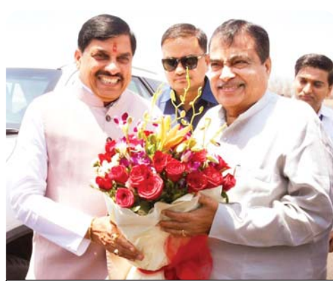
सीएम ने भोपाल स्टेट हेंगर पर केंद्रीय सड़क परिवहन और राजमार्ग मंत्री नितिन गडकरी से सौजन्य भेंटकर उनका स्वागत किया।