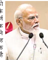
पीएम नरेंद्र मोदी ने दिल्ली में आयोजित नारी शक्ति वंदन सम्मेलन को संबोधित करते हुए महिला आरक्षण को लेकर बड़ा संदेश दिया।

21वीं सदी का बड़ा फैसला: अपने संबोधन में पीएम मोदी ने महिला आरक्षण को लेकर बड़ा संदेश दिया। उन्होंने कहा कि हमारे देश की संसद एक नया इतिहास रचने के करीब है। विधानसभाओं से लेकर संसद तक दशकों की प्रतीक्षा के अंत का समय आ गया है। 'नारी शक्ति वंदन अधिनियम' महिलाओं के जीवन का बड़ा अवसर बने जा रहा है। संसद तक पहुंचने का रास्ता आसान बनने जा रहा है। आज महिलाओं की भूमिका अहम हो गई है। हमारी योजनाओं से औरतें आर्थिक रूप से ताकतवर बनीं। उन्होंने कहा कि मैं गृहस्थ नहीं हूँ, लेकिन जानता सब हूँ।