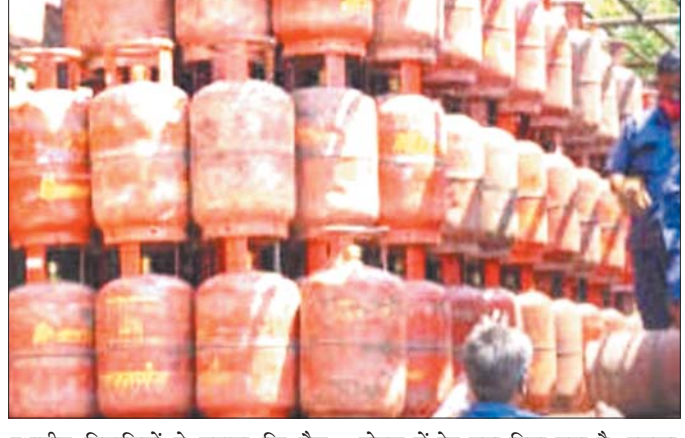
स्थानीय निवासियों ने बताया कि गैस एजेंसी संचालक द्वारा दुकानदारों को चोरी छिपे गैस सिलेण्डर की कालाबाजारी की जा रही है। यह कालाबाजारी अधिकतर रात्रि के समय हो रही है।

हनुमना, नि.प्र.। मध्य प्रदेश शासन के एवं विभिन्न जनप्रतिनिधियों द्वारा यह आश्वासन दिया जा रहा है कि हमारे सरकार के पास गैस की कोई कमी नहीं है लेकिन हनुमना की जनता गैस सिलेण्डर की समस्या से जूझ रही है। स्थानीय उपभोक्ताओं ने संवाददाता को बताया कि यदि गैस की जरा भी कमी नहीं है तो क्यों उपभोक्ताओं को 2000, 3000 रु में हनुमना खटखरी, पहाड़ी, गौरी, शाहपुर, कैलाशपुर, मऊगंज जिले के विभिन्न ग्रामीण एवं नगरीय स्थान में गैस की मारामारी एवं कालाबाजारी चल रही है, जिसका नतीजा यह हो रहा है कि अब स्थानीय दुकानदार ग्राहकों को गैस के नाम पर हर सामान बड़े दामों में बिक्री कर रहे हैं। संवाददाता को