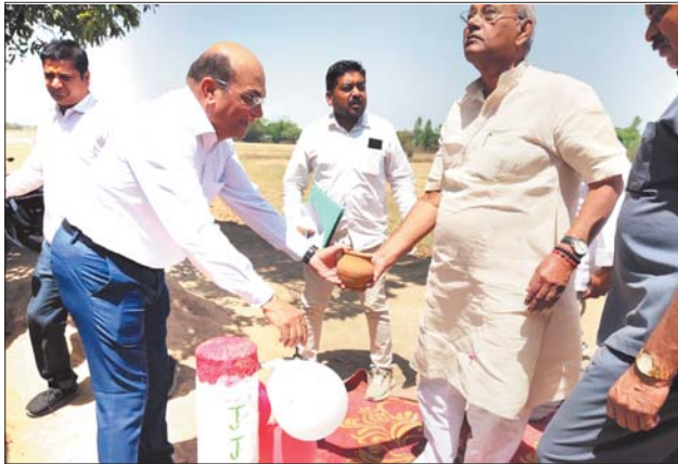
आपके लिए ही है। ग्राम पंचायत द्वारा तय की गई जल कर की मामूली सी राशि का भी नियमित भुगतान करें। समारोह में कार्यपालन यंत्री संजय पाण्डेय ने जल जीवन मिशन के तहत

मऊगंज, जागरण। जल जीवन मिशन के तहत मऊगंज जिले में समूह नलजल योजना तथा एकल नलजल योजनाओं का कार्य किया जा रहा है। पूर्ण एकल नलजल योजनाओं को समारोहपूर्वक ग्राम पंचायतों को हस्तांतरित किया जा रहा है। इस क्रम में ग्राम मझगवां में विधायक देवतालाब गिरीश गौतम ने नलजल योजना का लोकार्पण किया। इस अवसर पर विधायक गौतम ने कहा कि प्रधानमंत्री नरेन्द्र मोदी तथा मुख्यमंत्री डॉ. मोहन यादव के हर घर में नल से जल पहुंचाने का संकल्प धीरे-धीरे पूरा हो रहा है। मझगवां के सभी घरों में अब नल से साफ पानी पहुंचेगा। पानी का विवेकपूर्ण उपयोग करें। साथ ही सभी ग्रामवासी नलजल योजना के संचालन और संधारण में सहयोग करें। यह नलजल योजना