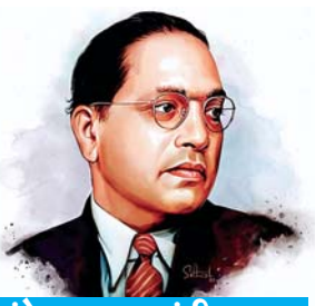
अंबेडकर जयंती आज