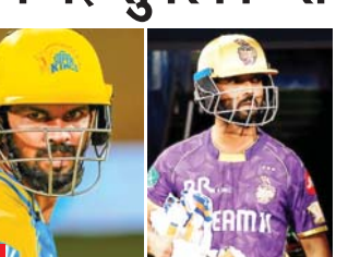
हेड टू हेड

चेन्नई, जेएनएन। आईपीएल 2026 में मंगलवार को लीग इतिहास की दो सबसे सफल, लेकिन इस सीजन की सबसे नीचे की टीमों कोलकाता नाइट राइडर्स (केकेआर) और चेन्नई सुपर किंग्स (सीएसके) का सामना चेन्नई में होगा। जहां केकेआर को अभी भी अपनी पहली जीत का इंतजार है, वहीं सीएसके की टीम को चार मैचों में से सिर्फ एक में जीत मिली है। पिछले मैच में जीत से उन्मुखित सीएसके को टीम केकेआर के खिलाफ दबदबा बनाने की कोशिश करेगी। सीएसके ने दिल्ली कैपिटल्स के खिलाफ खेल के हर विभाग में अच्छा प्रदर्शन करके सत्र की अपनी पहली जीत दर्ज की। उसकी इस जीत के नायक संजू सैमसन रहे, जिन्होंने 56 गेंद पर नाबाद 115 रन की पारी खेली। इसके बाद उसके गेंदबाजों ने भी अच्छा प्रदर्शन किया। बाएं हाथ के तेज गेंदबाज