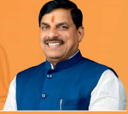
डॉ. मोहन यादव मुख्यमंत्री, मध्यप्रदेश