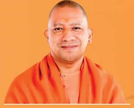
योगी आदित्यनाथ मुख्यमंत्री, उत्तर प्रदेश

3 अप्रैल 2026 | विक्रम सम्वत् 2083, वैशाख कृष्ण पक्ष सायं 7.00 बजे, बी.एल.डब्ल्यू. मैदान, वाराणसी, उत्तर प्रदेश