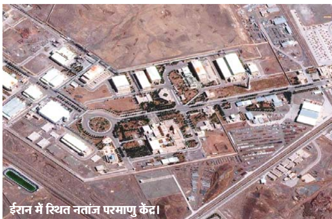
ईरान में स्थित नतांज परमाणु केंद्र।

नई दिल्ली, जेएनएन। ईरान और अमेरिका-इजरायल के बीच युद्ध थमता नहीं दिख रहा है। अमेरिका-इजरायल की संयुक्त एयरस्ट्राइक में ईरान के नतांज परमाणु संवर्धन केंद्र को निशाना बनाया गया। हालांकि, इजरायल ने इस हमले से इनकार किया है। ईरानी सरकारी मीडिया के मुताबिक इस हमले में किसी तरह का रेडियोधर्मी रिसाव नहीं हुआ है न ही कोई खतरा है। इसके जवाब में ईरान ने सुबह हिंद महासागर में स्थित अमेरिका-ब्रिटेन के जॉइंट सैन्य बेस डिएगो गार्सिया पर बैलिस्टिक मिसाइलें दागीं। अमेरिकी अधिकारियों ने इसकी पुष्टि की है। उनके मुताबिक, ईरान ने 2 मिसाइलें दागीं, लेकिन कोई भी बेस को निशाना नहीं बना सकी। यह बेस ईरान के तट से 3810 किमी दूर है। तेहरान से इसकी दूरी 5 हजार किमी से भी ज्यादा है। डिएगो गार्सिया अमेरिका के लिए बेहद अहम सैन्य ठिकाना है। इस बेस से अमेरिका बॉम्बर प्लेन का इस्तेमाल करता है। यहां बड़े टैंकर विमान (जैसे केसी-135) और निगरानी करने वाले विमान भी काम कर सकते हैं।