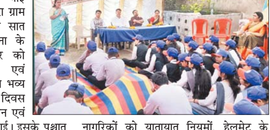
एनएसएस शिविर का समापन समारोह में दीप प्रज्वलन एवं नागरिकों को यातायात नियमों, हेलमेट के महत्व एवं सड़क सुरक्षा के प्रति जागरुक किया।

रीवा। महारानी लक्ष्मी बाई कॉलेज ऑफ टेक्नोलॉजी द्वारा ग्राम पंचायत इटौरा में आयोजित सात दिवसीय राष्ट्रीय सेवा योजना के विशेष शिविर का शनिवार को जागरुकता कार्यक्रमों एवं सांस्कृतिक प्रस्तुतियों के साथ भव्य समापन किया गया। समापन दिवस की शुरुआत प्रातःकाल राष्ट्रगान एवं एनएसएस गीत के साथ की गई। इसके पश्चात स्वयंसेवकों द्वारा एड्रेस जागरुकता रैली निकाली गई, जिसमें ग्रामवासियों को एड्रेस के लक्षण, बचाव एवं रोकथाम के संबंध में जानकारी प्रदान की गई। रैली के बाद स्वयंसेवकों ने इटौरा बायपास के पास आम