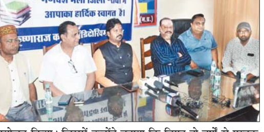
पुस्तक विक्रेता संघ ने खन्ना चौराहे में प्रेस वार्ता का आयोजन किया।

जागरण, रीवा। पुस्तक मेले के आयोजन को लेकर शनिवार को पुस्तक विक्रेता संघ ने खन्ना चौराहे में प्रेस वार्ता का आयोजन किया। जिसमें उन्होंने बताया कि विगत दो वर्षों से पुस्तक मेले का आयोजन हो रहा है यह तीसरा वर्ष है। सभी पुस्तक विक्रेता इसका स्वागत व समर्थन करते हैं। मेले में पुस्तक विक्रेता और कपड़ा व्यापारी सहभागिता निभा रहे हैं। पुस्तक मेले में अभिभावकों को विशेष लाभ देनेका उद्देश्य है, जिसमें किताबों में जीरो से अप 10 फीसदी तक लाभ दिया जा रहा है। नोट बुक, कॉपी में 10 से 40 फीसदी तक भारी छूट दी जाएगी। पुस्तक मेला सुबह 9 बजे से चालू होकर रात्रि 8 बजे तक चलेगा।