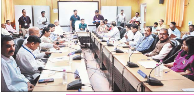
मेडिकल कॉलेज के सामान्य सभा की बैठक शनिवार को आयोजित की गई।

एम्एस मेडिकल कॉलेज के सामान्य सभा की बैठक शनिवार को आयोजित की गई। अध्यक्षता उप मुख्यमंत्री एवं स्वास्थ्य मंत्री राजेन्द्र शुक्ल ने की। बैठक मेडिकल कॉलेज सभागार में आयोजित की गई। बैठक में उप मुख्यमंत्री ने कहा कि रीवा में चिकित्सा सुविधाओं का तेजी से विस्तार हो रहा है। सुपर स्पेशलिटी अस्पताल में 13 फिडली ट्रांसप्लान्ट और 36 ओपन हार्ट सर्जरी के सफल ऑपरेशन होना यहां के लिए बड़ी उपलब्धि है। उन्होंने संचालक चिकित्सा शिक्षा से कहा कि सुपर स्पेशलिटी अस्पताल में रिक्त पदों में भर्ती की प्रक्रिया तेज करें। जिससे यहाँ नये विभागों में कार्य शुरू हो सके। डीन सुपर स्पेशलिटी के डॉक्टरों को आयुष्मान योजना की शेष बची प्रोत्साहन राशि का तत्काल वितरण कराये। डॉक्टरों के लिए दो माह में आधुनिक आवास भी उपलब्ध हो जायेंगे। कैन्सर यूनिट भवन का निर्माण पूरा होते ही दो माह में कैन्सर के उपचार की आधुनिक सुविधा उपलब्ध हो जायेगी। कैन्सर के उपचार के लिए लीनेक और पेट स्कैन मशीन शीघ्र स्थापित हो जायेगी। कैन्सर अस्पताल में 200 बेड में भर्ती की सुविधा मिलेगी।