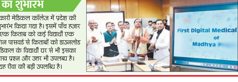
उप मुख्यमंत्री ने कहा कि सरकारी मेडिकल कॉलेज में प्रदेश की प्रथम डिजिटल लाइब्रेरी का शुभारंभ किया गया।

उप मुख्यमंत्री ने कहा कि सरकारी मेडिकल कॉलेज में प्रदेश की प्रथम डिजिटल लाइब्रेरी का शुभारंभ किया गया। इसमें पांच हजार किताबें डिजिटली उपलब्ध हैं। एक किताब को कई विद्यार्थी एक साथ पढ़ सकते हैं। इसके लॉगिन पासवर्ड से किताबों को डाउनलोड करने की भी सुविधा रहेगी। मेडिकल के विद्यार्थी घर से भी इसका लाभ उठा सकते हैं। इसमें 4 लाख प्रश्न और उत्तर भी उपलब्ध हैं। मेडिकल एजुकेशन के लिए यह रीवा की बड़ी उपलब्धि है।