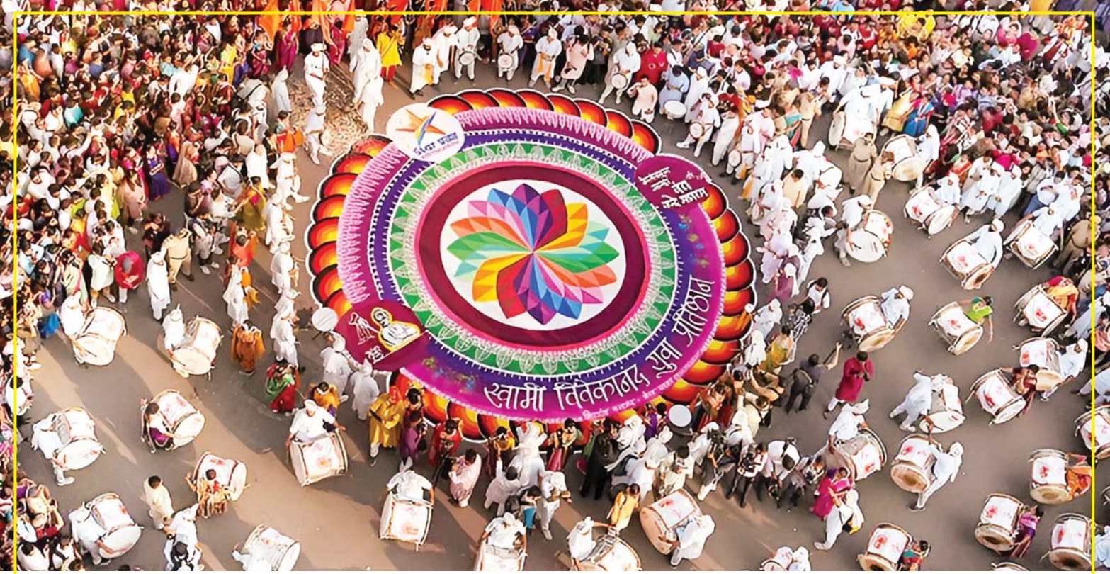
जुड़ी पड़वा त्यौहार हिंदू नव वर्ष के रूप में मनाया जाता है। इस अवसर पर मुंबई के गिरगांव में एक भव्य शोभायात्रा का आयोजन किया गया। फोटो में एक बड़ी और रंगीन रंगोली है, जो त्योहारों का एक पारंपरिक हिस्सा है। डोल-ताशों की थाप के साथ पारंपरिक वेशभूषा में लोग इस उत्सव में उत्साह के साथ भाग लेते हैं।

नई दिल्ली, जेएनएन। फेसबुक-इंस्टाग्राम की मालिक कंपनी मेटा की नई रिपोर्ट में खुलासा हुआ है कि भारत अब दुनिया के अंतरराष्ट्रीय स्कैम गिरोहों का दूसरा सबसे बड़ा शिकार बन गया है। सिर्फ अमेरिका के अंग्रेजी बोलने वाले यूजर्स के बाद भारत टॉप पर है। ये ठग अब इनने पेशेवर और संगठित हो गए हैं कि वे एआई टूल्स का इस्तेमाल करके लाखों लोगों को एक साथ फंसाने लगे हैं। एआई से बने सुपर ठग कलचरली फिट बातचीत होती है। ये मैसेज इतने पर्सनलाइज्ड होते हैं कि पढ़ने वाला सोचता है। ये तो मेरे लिए ही लिखा है। रिपोर्ट में के अनुसार, अपराधी स्कैम सिंडिकेट सबसे पहले अमेरिका के अंग्रेजी बोलने वाले यूजर्स को निशाना बनाते हैं, उसके ठीक बाद भारत के यूजर्स आते हैं। इसके बाद मंदारिन बोलने वाले जैसे चीन, ताइवान, हांगकांग, सिंगापुर और फिर जापान-दक्षिण कोरिया के लोग टारगेट होते हैं।