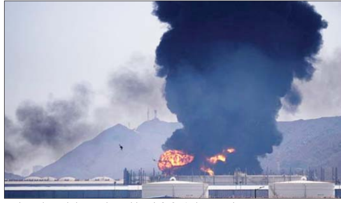
फुजैराह में हमले के बाद तेल स्टोरेज फैसिलिटी से आग और धुंए का गुबार उठता हुआ।

कतर: ईरान ने रासलफान गैस प्लांट पर हमला किया, जिससे कतर ने एलएनजी उत्पादन अस्थायी रूप से रोक दिया है। यह हमला ईरान के अपने 'साउथ पास' गैसफील्ड पर हमले का बदला बताया। यूएई: यूएई की फुजैराह तेल सुविधा अल हसन गैस फील्ड को भी ईरानी ड्रोन और मिसाइलों द्वारा निशाना बनाया गया। इजराइल: इजराइल के हाइफा रिफाइनरी, लेविथान गैस फील्ड पर हमलों के बाद परिचालन बंद करना पड़ा। ईरान: इससे पहले अमेरिका-इजराइल द्वारा ईरान के विशाल साउथ पास गैस फील्ड पर हमले किए गए थे, जिसके जवाब में ईरान ने अन्य खाड़ी देशों पर हमले शुरू किए।