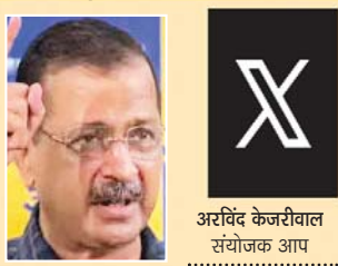
अरविंद केजरीवाल संयोजक आप

पालम में पीठिष्ठ परिवार से मिलने गया था लेकिन वीजेपी कार्यकर्ताओं ने वहां हमें मिलने से रोका, बदसलूकी की, कुर्सीयां फेंकीं.. ये कैसे लोग हैं? इन लोगों में मानवता खत्म हो चुकी है। सरकार की नाकामी और लापरवाही ने 9 लोगों की जान ले ली। फायर ब्रिगेड की हाइड्रोलिक लिफ्ट तक नहीं खुली, लोग घंटों मदद के लिए पुकारते रहे और तड़प-तड़पकर दम तोड़ दिया। शोक संतप्त परिवार के घर पर ये लोग जुंझुंदाई कर रहे हैं? ये अमानवीयता की पराकाष्ठा है।