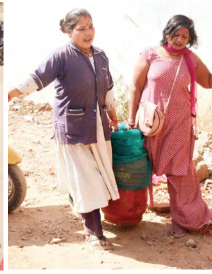
प्रभात चौराहे पर सिलेंडर ले जाती हैं महिलाएं।