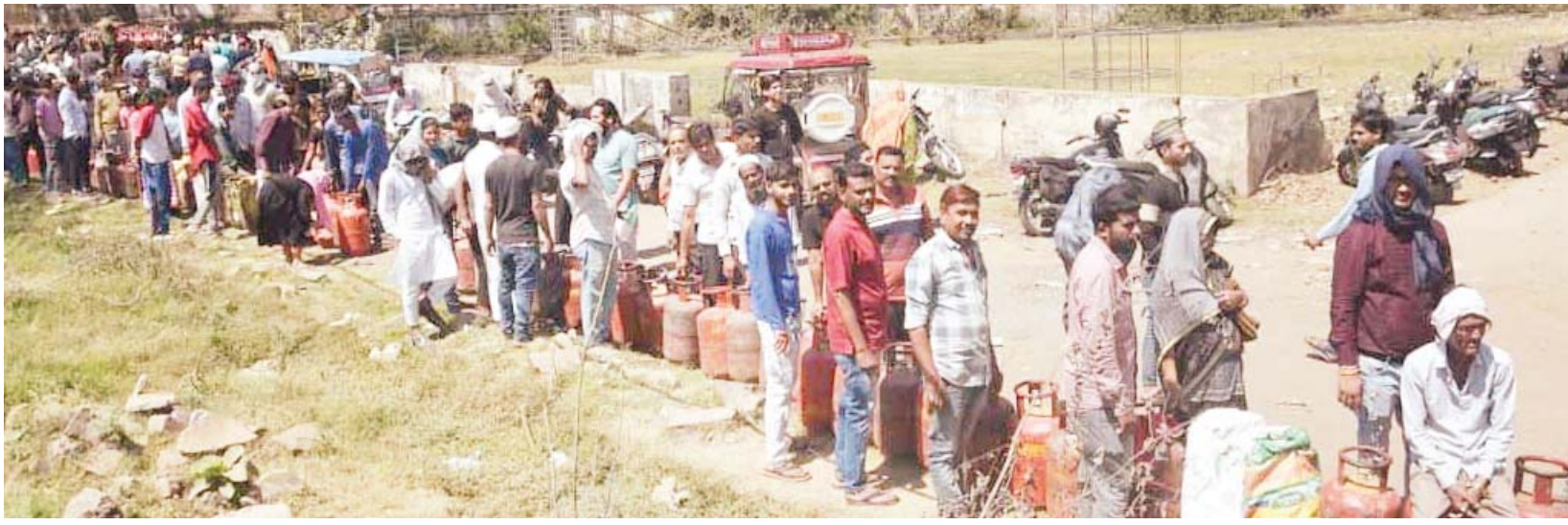
राजधानी के नादरा बस स्टैंड के पास स्थित रेलवे कॉलोनी के मैदान में गैस सिलेंडर के लिए लगी लाइन। यहां एचपी और इंडेन गैस एजेंसी की गाड़ियां सिलेंडर बांटने के लिए पहुंचती हैं।

स्थान: मध्यप्रदेश जनजातीय संग्रहालय समय: सुबह 11 बजे से