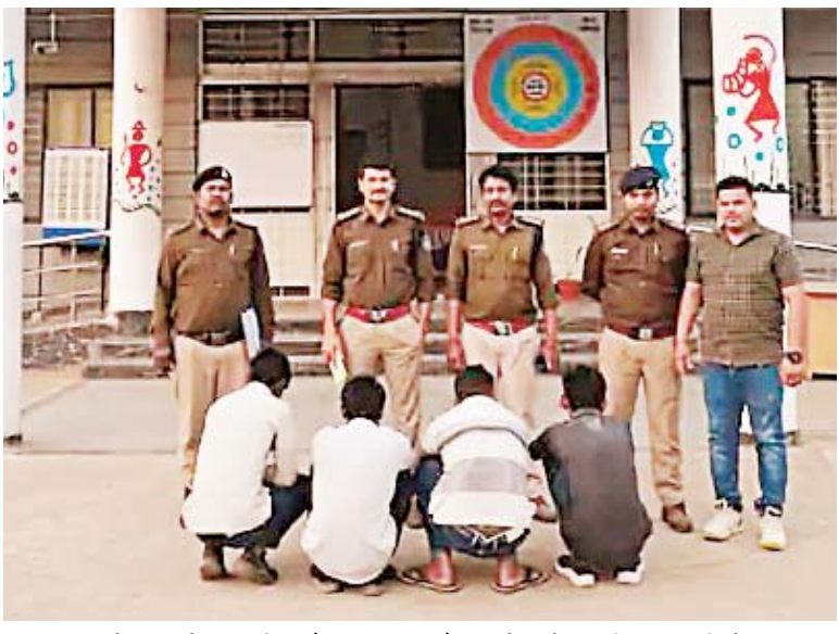
ऑनलाइन गेमिंग, सेक्सटारन और साइबर फ्रॉड से कमाई गई काली कमाई को खपाने के लिए करते थे। पुलिस ने छापामार गिरोह के 17 आरोपियों को गिरफ्तार किया है। गिरोह से मिली जानकारी के बाद 35 म्यूल अकाउंट्स को तत्काल प्रभाव से बंद कराया गया। साथ ही 9 पासबुक, 4 एटीएम कार्ड और 9 मोबाइल फोन जब्त किए हैं।

जागरण, नरसिंहपुर। भोले-भाले लोगों के खाते खुलवाकर उनके जरिए ऑनलाइन गेमिंग, सेक्सटारन और साइबर फ्रॉड से काली कमाई करने वाला एक बड़ा गिरोह नरसिंहपुर पुलिस के हत्थे चढ़ा है। यह गिरोह म्यूल खातों के जरिए अब 15 करोड़ रुपए से अधिक का अवैध लेन-देन कर चुका है। गिरोह के पास से पुलिस को 180 से अधिक बैंक खातों का रिकॉर्ड मिला है। पुलिस के मुताबिक साइबर ठगी करने वाले इस गिरोह की शिकायतें लगातार मिल रही थीं। शिकायतों के आधार पर पुलिस ने तकनीकी साक्ष्यों से लिंक बढ़ाते हुए पुलिस ने छापामार इस गिरोह का भंडाफोड़ किया। यह गिरोह लोगों को लालच देकर खाते खुलवाता था। फिर इनके सारे दस्तावेज, पासबुक, एटीएम अपने पास रख लेता था। आम लोगों के इन म्यूल अकाउंट (क्रिएट किए खाते) से यह गिरोह करोड़ों रुपए का अवैध लेन-देन कर रहा था। अब तक करीब 180 बैंक खातों गिरोह खुलवा चुका था। इनके जरिए 15 करोड़ रुपए से अधिक की राशि का अवैध लेन-देन भी पुलिस के सामने आया है। बताया जाता है कि लोगों के खाते खुलवाकर गिरोह के सदस्य इन खातों का इस्तेमाल