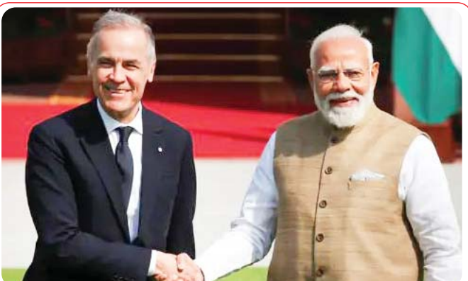
पश्चिम एशिया संकट पर पीएम का कड़ा संदेश

नई दिल्ली, जेएनएन। वैश्विक स्तर पर चल रही उथल-पुथल और पश्चिम एशिया में जारी तनाव के बीच, भारत ने कूटनीतिक और आर्थिक मोर्चे पर एक बड़ा कदम उठाया है। एक ओर जहां भू-राजनीतिक संकट ने बाजारों को हिला दिया है, वहीं भारत और कनाडा के बीच ऊर्जा, व्यापार और रणनीतिक खनिजों को लेकर ऐतिहासिक समझौते हुए हैं। इन समझौतों के दौरान प्रधानमंत्री नरेंद्र मोदी ने पश्चिम एशिया के हालात पर गहरी चिंता व्यक्त करते हुए देशवासियों को सुरक्षा का पूरा भरोसा दिलाया है। भारत और कनाडा ने यूरेनियम पर एक ऐतिहासिक समझौते पर भी हस्ताक्षर किए हैं।