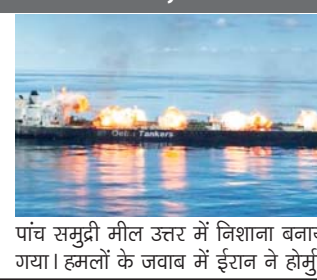
पांच समुद्री मील उत्तर में निशाना बनाया गया। हमलों के जवाब में ईरान ने होर्मुज

अमेरिका-इजरायल के हमलों के बाद बढ़ते तनाव के बीच ओमान के तट पर होर्मुज के रणनीतिक स्ट्रेट में एक तेल टैंकर पर हमला किया गया, जिसमें चालक दल के 8 सदस्य घायल हो गए और पूर्ण निकासी के लिए मजबूर होना पड़ा। ओमान के समुद्री सुरक्षा केंद्र ने कहा कि पलाऊ के झंडे वाले टैंकर स्काईलाइट को मुसंदम गवर्नरेंट में खासाब पोर्ट से