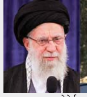
आयतुल्ला खामेनेई सुप्रीम लीडर

हमले के वक्त कमांडर्स के साथ बैठक कर रहे थे खामेनेई