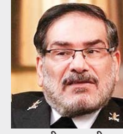
अली शमखानी रक्षा परिषद प्रमुख