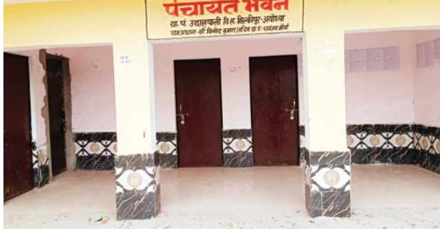
दूर-दराज के गांवों का विकास धीमा

विशेष संवाददाता, भोपाल। मध्यप्रदेश में 250 से अधिक ग्राम पंचायतों को नगर पंचायत परिषद तो बना दिया गया, लेकिन यहां अभी भी मूलभूत सुविधाएं वहां के वाशियों से कोसों दूर हैं। स्थिति यह है कि अब तक ऐसे दो सौ से ज्यादा नगर पंचायतों के लिए न तो सीवेज और कचरा प्रबंधन काम काम हुआ है और न वहां के विकास के लिए कोई कदम उठाए गए हैं। गौरतलब है कि पिछले कुछ वर्षों में मध्यप्रदेश की 273 ग्राम पंचायतों को अपग्रेड कर नगर पंचायत परिषद का दर्जा दिया गया है। लेकिन यहां पर अभी भी सुविधाएं जस की तस हैं। इनमें सबसे अहम गांव वे हैं, जिन्हें प्रदेश के नगर निगम क्षेत्र के दायरे में लाकर वहां समी-अर्बन एरिया के रूप में चिन्हित किया गया है। स्थिति यह है कि इन गांवों में प्रशासनिक बदलाव के बावजूद बुनियादी सुविधाओं का काफी अभाव है। ग्रामीण से शहरी ढांचा बनने की प्रक्रिया में इन क्षेत्रों में जल निकासी के साथ-साथ पक्की सड़कें, स्ट्रीट लाइट और शहरी नियोजन की कमी का सामना करना पड़ रहा है। इतना ही नहीं पंचायतों के अधिकार खत्म होने और नगर परिषद के अधिकार पूरी तरह से लागू न होने से वहां के विकास के काम पूरी तरह से ठप पड़े हुए हैं। इसी तरह इस बदलाव से वहां के नागरिकों पर आर्थिक बोझ भी बढ़ा है। क्योंकि उनसे शहरी कर वसूल किया जा रहा है।