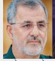
मोहम्मद पाकपोर कमांडर इन चीफ