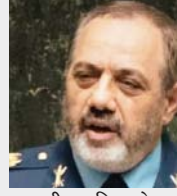
अजीज नासिरजादेह रक्षा मंत्री