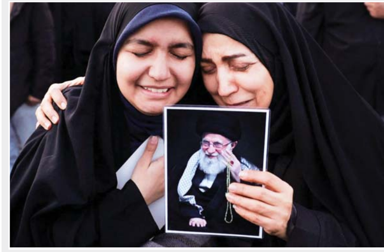
तेहरान में सुप्रीम कमांडर आयतुल्ला खामेनेई के मारे जाने के बाद मातम मनाने समर्थक।