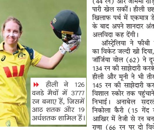
● भारत को पहले दो वनडे में क्रमशः छह और पांच विकेट से हार मिली थी। मेहमान टीम ने पिछली तीन मैचों की टी-20 सीरीज 0-3 से जीत ली थी।

जेएनएन, होबार्ट कप्तान एलिसा हीली (98 गेंद पर 158 रन) ने शतकीय पारी खेलकर शानदार अंदाज में वनडे क्रिकेट को अलविदा कहा, जिससे ऑस्ट्रेलिया ने रविवार को तीसरे और आखिरी महिला मैच में विश्व चैंपियन भारत को 185 रन से हराकर सीरीज 3-0 से क्लीन स्वीप की। यह महिला वनडे में रनों के अंतर से भारत की चौथी सबसे बड़ी हार है। 35 साल की हीली का यह अंतिम वनडे मैच था, जिसके 158 रन और बेथ मूनी के नाबाद 106 रन की मदद से ऑस्ट्रेलिया ने बल्लेबाजी का न्योता मिलने के बाद सात विकेट पर 409 रन का बड़ा स्कोर बनाया।