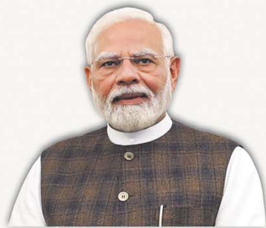
नरेन्द्र मोदी, प्रधानमंत्री