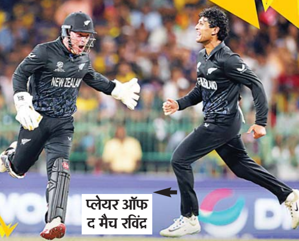
प्लेयर ऑफ द मैच रविंद्र

जेएनएन, कोलंबो रचिन रविंद्र (32 रन और चार विकेट) के शानदार हरफनमौला प्रदर्शन से न्यूजीलैंड ने बुधवार को टी-20 विश्व कप के सुपर आठ मैच में श्रीलंका को 61 रन से शिकस्त दी, जिससे सह मेजबान टीम टूर्नामेंट से बाहर हो गई। न्यूजीलैंड के कप्तान मिचेल सैंटर (47 रन) और कोल मर्कोची (नाबाद 31 रन) के बीच सातवें विकेट के लिए 47 गेंद में 84 रन की साझेदारी से टीम ने बल्लेबाजी का न्योता मिलने के बाद सात विकेट पर 168 रन बनाए। एक समय ऐसा लग रहा था कि न्यूजीलैंड की टीम पूरे 20 ओवर भी नहीं खेल पाएगी, लेकिन सैंटर और मर्कोची ने न्यूजीलैंड को न सिर्फ संकट से उबार, बल्कि दोनों स्पिन को मददगार पिच पर अपनी टीम को एक बड़े स्कोर तक ले गए। श्रीलंका ने न्यूजीलैंड को अंतिम चार ओवर में 70 रन बनाने दिए। सुपर-8 के अपने पहले मैच में इंग्लैंड से हारने वाली टीम को फिर बल्लेबाजी ने निराश किया। श्रीलंकाई टीम रविंद्र (27 रन देकर चार विकेट) के करियर के सर्वश्रेष्ठ गेंदबाजी प्रदर्शन के सामने लक्ष्य का पीछा करते हुए 20 ओवर में आठ विकेट पर 107 रन ही बना सकी। न्यूजीलैंड के लिए जहां स्पिन की जिम्मेदारी रविंद्र ने संभाली तो वहीं तेज गेंदबाज मैट हेनरी ने पावरप्ले में दो ओवर में एक मेडन से तीन रन देकर दो विकेट झटककर शानदार प्रदर्शन किया। न्यूजीलैंड ने हेनरी की मदद से पावरप्ले में श्रीलंका को परत किया।