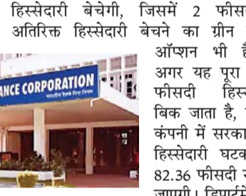
आईआरएफसी में 4 फीसदी हिस्सेदारी बेचेगी सरकार, फ्लोर प्राइस 104 तय

मुंबई, जेएनएन। सरकार रेलवे की फाइनेंस कंपनी आईआरएफसी में अपनी 4 फीसदी हिस्सेदारी बेच रही है। यह बिक्री ऑफर फॉर सेल के जरिए की जा रही है। यह ऑफर नॉन-रिटेल निवेशकों के लिए आज से खुल गया है। वहीं, रिटेल निवेशक गुरुवार, 26 फरवरी को अपनी बोलियां लगा सकेंगे। इसके लिए फ्लोर प्राइस 104 प्रति शेयर तय किया गया है। मंगलवार, 24 फरवरी को आईआरएफसी का शेयर पर बंद हुआ था। यानी सरकार निवेशकों को मौजूदा कीमत से डिस्काउंट पर शेयर ऑफर किया है। हालांकि आज ये शेयर करीब 4 फीसदी नीचे 105 रुपए पर आ गया है। आईआरएफसी में सरकार की कुल हिस्सेदारी 86.36 फीसदी है। ऑफरएस के जरिए सरकार 2 फीसदी हिस्सेदारी बेचेगी, जिसमें 2 फीसदी अतिरिक्त हिस्सेदारी बेचने का ग्रीन शू ऑप्शन भी है। अगर यह पूरा 4 फीसदी हिस्सा बिक जाता है, तो कंपनी में सरकारी हिस्सेदारी घटकर 82.36 फीसदी रह जाएगी। डिपॉजिट ऑफ इन्वेस्टमेंट एंड पब्लिक एसेट मैनेजमेंट के सचिव ने कहा कि 104 प्रति शेयर के हिसाब से 4 फीसदी हिस्सेदारी (करीब 52.26 करोड़ शेयर) बेचने पर सरकार को लगभग 5,430 करोड़ मिलेंगे। बेस ऑफर साइज 26.13 करोड़ शेयरों का रखा गया है। डीआईपीएम सचिव के मुताबिक, यह ऑफर नॉन-रिटेल निवेशकों के लिए बुधवार, 26 फरवरी को खुल गया है। रिटेल निवेशक 26 फरवरी को अपनी बोलियां लगा सकेंगे।