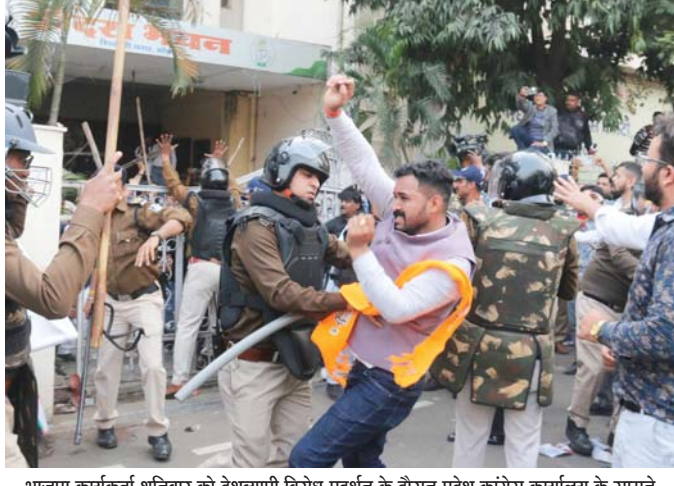
भाजपा कार्यकर्ता शनिवार को देशव्यापी विरोध-प्रदर्शन के दौरान प्रदेश कांग्रेस कार्यालय के सामने पुलिस से भिड़ गए। इस दौरान धक्का-मुक्की हिंसक झड़प में बदल गई।

दरअसल, मप्र भाजपा युवा मोर्चा ने दिल्ली में इंडिया एआई इम्पैक्ट समिट 2026 के दौरान शुक्रवार को यूथ कांग्रेस द्वारा नग्न प्रदर्शन के विरोध में शनिवार को प्रदेशभर के कांग्रेस दफ्तरों का घेराव करने की घोषणा की थी। इंदौर, भोपाल में हुए प्रदर्शन आपसी टकराव और झड़प में तब्दील हो गए, जिससे दोनों स्थानों पर धक्कामुक्की, पथराव जैसी स्थिति निर्मित हो गई, जिसमें कई कार्यकर्ताओं को चोटें आई हैं। भोपाल में भाजयुमो कार्यकर्ता नारेबाजी करते हुए शिवाजी नगर स्थित पीसीसी के गेट तक पहुंच गए, जबकि पुलिस ने पहले ही वहां पर बैरिकेड लगाए हुए थे। नारेबाजी सुनकर पीसीसी में मौजूद कांग्रेस कार्यकर्ता भी बाहर निकले और गेट के पास एकत्र हो गए। इनमें से कई के हाथों में डंडे भी दिखाई दिए। दोनों पक्षों में नारेबाजी हुई, जो बाद में धक्का-मुक्की और पथराव में बदल गई। भाजयुमो कार्यकर्ताओं ने पीसीसी के बाहर लगे पोस्टर और बैनर फाड़ दिए। बाद में पुलिस ने उन्हें बाहर निकाल दिया। कामोवेश ऐसी ही स्थिति इंदौर के कांग्रेस कार्यालय में भी उत्पन्न हो गई।