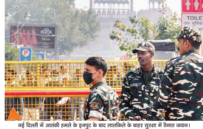
नई दिल्ली में आतंकी हमले के इन्फुट के बाद लालकिले के बाहर सुरक्षा में तैनात जवान।

नई दिल्ली, जेएनएन। केंद्रीय खुफिया एजेंसियों से मिले इन्फुट के बाद दिल्ली में सिक्योरिटी बढ़ाई गई है। लाल किले के आसपास आईईडी ब्लास्ट की आशंका को लेकर अलर्ट जारी किया गया। खुफिया जानकारी के अनुसार पाकिस्तान स्थित आतंकी संगठन लश्कर-ए-तैयबा (एलईटी) ने भारत के प्रमुख धार्मिक स्थलों को अपने निशाने पर रखा है। सूत्रों के मुताबिक, चांदनी चौक इलाके का मंदिर भी आतंकीयों के टारगेट पर है। इसके चलते दिल्ली के प्रमुख धार्मिक और ऐतिहासिक स्थलों पर सुरक्षा बढ़ाई गई है। हालांकि, इन सूचनाओं की अभी जांच की जा रही है, लेकिन एहतियात बरती जा रही है।