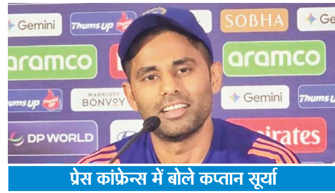
प्रेस कॉन्फ्रेंस में बोले कप्तान सूर्या

दक्षिण अफ्रीका: एडेन मार्कम (कप्तान), किंटन डीकोक (विकेटकीपर), रयान रिक्लेन्ड, डेवाल्ड ब्रेविस, ट्रिस्टन स्टब्स, डेविड मिलर, मार्को यानसन, केशव महाराज, कागिसो रबाडा, लुंगी एनगिडी, जॉर्ज लिले।