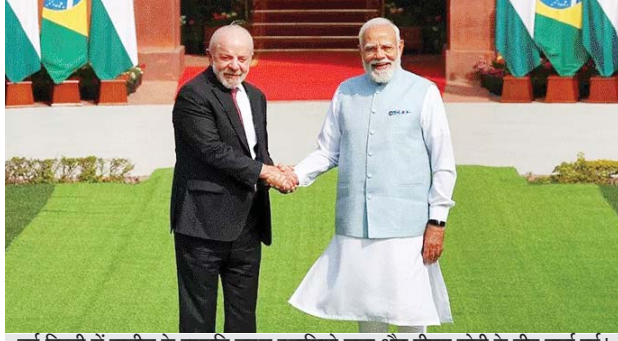
नई दिल्ली में ब्राजील के राष्ट्रपति लुइज इनासियो लूला और पीएम मोदी के बीच वार्ता हुई।

राष्ट्रपति लूला ने पहलगाम में हुए आतंकी हमले की निंदा की और कहा कि आतंकवाद किसी धर्म या राष्ट्रीयता से जुड़ा नहीं है। प्रधानमंत्री मोदी ने भी दोहराया कि आतंकवाद और उसके समर्थक पूरी मानवता के दुश्मन हैं। दोनों नेताओं ने कहा कि वैश्विक चुनौतियों के समाधान के लिए संवाद और कूटनीति ही रास्ता है तथा अंतरराष्ट्रीय संस्थानों में सुधार समय की जरूरत है।