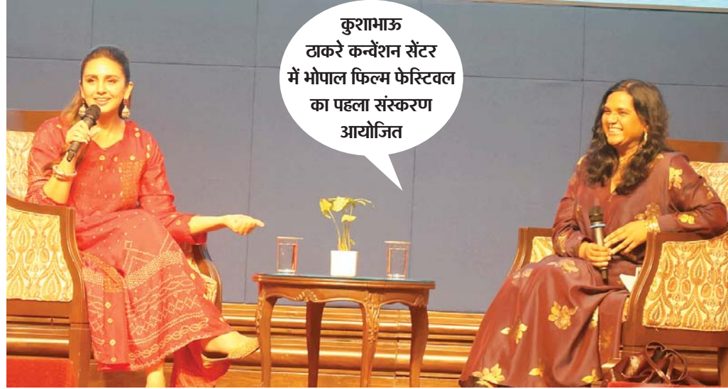
कुशाभाऊ ठाकरे कन्वेंशन सेंटर में भोपाल फिल्म फेस्टिवल का पहला संस्करण आयोजित