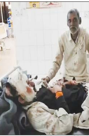
एक्सीडेंट में घायल बेटे को प्राइवेट डॉक्टर ने रोका