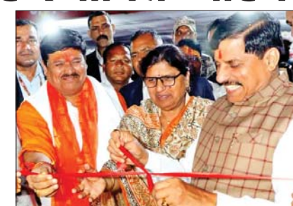
उज्जैन में रविवार को विक्रम व्यापार मेले का शुभारंभ करते सीएम डॉ. मोहन यादव।

मुख्यमंत्री ने कहा कि सम्राट विक्रमादित्य की नगरी अर्वातिका विकास के नए कीर्तिमान बना रही है। व्यापार, व्यवसाय में बाबाश्री महाकाल की नगरी तेजी से प्रगति कर रही है। विक्रम व्यापार मेले का आयोजन तीसरी बार किया जा रहा है। व्यापार मेले से जिले और आसपास के क्षेत्र में आर्थिक प्रगति हुई है। उन्होंने कहा कि विक्रम व्यापार मेला वर्ष 2024 में 23,705 वाहनों की बिक्री पर लगभग 122 करोड़ की छूट प्रदान की गई थी, वर्ष 2025 में 36,225 वाहनों की बिक्री पर 187 करोड़ की छूट प्रदान की गई थी। उन्होंने कहा कि बाबा महाकाल के प्रसाद के रूप में वाहन लेने वालों को छूट का पर्याप्त लाभ मिल रहा है। इस वर्ष नगर निगम को अभी तक 4 करोड़ 10 लाख रुपए की आय हो गई है। इस वर्ष विक्रम व्यापार मेले में फोर व्हीलर के 139 स्टाल, टू व्हीलर के 36 स्टाल, कार डेकोरेशन, सॉनी पॉलर सहित अन्य उपयोगी सामग्रियों के स्टाल लगाए गए हैं। बैंक तथा उद्योग व्यवसाय से जुड़े अन्य संस्थान भी मेले में उपस्थित हैं। व्यापार-व्यवसाय- उद्यमिता, कृषि आदि सहित