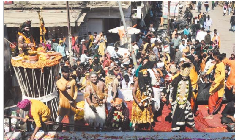
रूद्राभिषेक कर प्रसाद अर्पण किया। दोपहर भर गया था। शाम तक भक्तों द्वारा शिव शक्ति तक मंदिर परिसर भक्तों की भीड़ से खचाखच का पूजन, अर्चना का दौर चलता रहा।