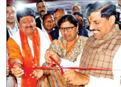
उज्जैन में रविवार को विक्रम व्यापार मेले का शुभारंभ करते सीएम डॉ. मोहन यादव।

विशेष संवाददाता, भोपाल। मुख्यमंत्री डॉ. मोहन यादव ने रविवार को उज्जैन में विक्रमोत्सव और विक्रम व्यापार मेले का शुभारंभ किया। इस मौके पर सीएम ने कहा कि इस तरह के आयोजनों से जहां निकायों की आय बढ़ती है, तो वहीं वे आत्मनिर्भर बनने की दिशा में तेजी से कदम उठाते हैं। उन्होंने कहा कि प्रधानमंत्री नरेंद्र मोदी के नेतृत्व में देश में सभी क्षेत्रों में विकास के नए प्रतिमान स्थापित हो रहे हैं। विक्रमोत्सव और विक्रम व्यापार मेला इस तथ्य का परिचायक है।