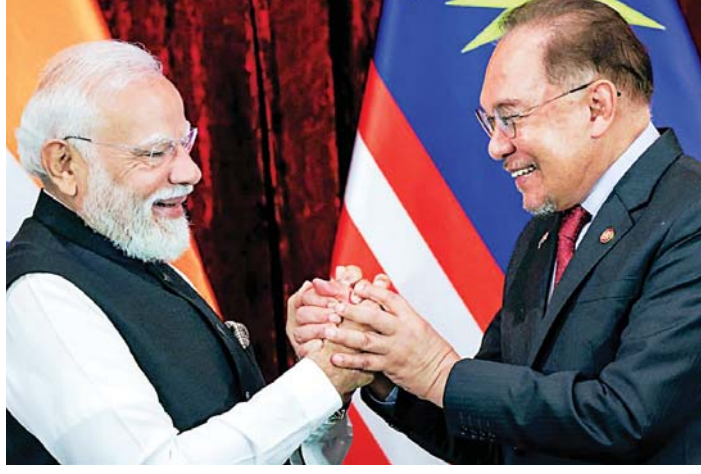
छह बड़ी डील करने के बाद प्रधानमंत्री नरेंद्र मोदी के साथ मलेशिया के प्रधानमंत्री इब्राहिम।

प्रधानमंत्री मोदी की दो दिवसीय मलेशिया यात्रा के दौरान हुई बातचीत में यह साफ दिखा कि दोनों देश पारंपरिक सहयोग से आगे बढ़कर उभरती तकनीकों और भविष्य की अर्थव्यवस्था पर फोकस कर रहे हैं। विदेश मंत्रालय के अनुसार, यह यात्रा भारत-मलेशिया की व्यापक रणनीतिक साझेदारी को और मजबूत करने की दिशा में एक अहम पड़ाव साबित हुई है। सेमीकंडक्टर और एआई जैसे क्षेत्रों में सहयोग को खास अहमियत दी गई है। वैश्विक सप्लाइ चेन में सेमीकंडक्टर की रणनीतिक भूमिका को देखते हुए भारत और मलेशिया ने इस सेक्टर में मिलकर आत्मनिर्भरता और आर्थिक मजबूती मिलेगी। प्रधानमंत्री मोदी ने इसे 'लोगों के जीवन को सरल बनाने वाला कदम' बताया और कहा कि किसी भी साझेदारी की असली सफलता तभी मानी जाती है, जब उसका लाभ आम नागरिकों तक पहुंचे। थिरुवल्लुवर केंद्र का उद्देश्य महान तमिल कवि और दार्शनिक थिरुवल्लुवर की शिक्षाओं को बढ़ावा देना और भारत-मलेशिया के बीच सांस्कृतिक व जन-स्तरीय संबंधों को और गहरा करना है। वहीं शिक्षा क्षेत्र में न सिर्फ शैक्षणिक संबंध मजबूत होंगे, बल्कि स्वास्थ्य पर्यटन को भी नई दिशा मिल सकती है।