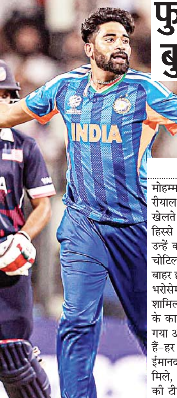
जेएनएन, मुंबई मोहम्मद सिराज अपनी पसंदीदा फुटबॉल टीम रीयल मैड्रिड को रीयल सोसिदाद के खिलाफ खेलते हुए देखने के लिए दुनिया के दूसरी क्रम में जाने की तैयारी कर रहे थे कि तभी उन्हें कप्तान सूर्यकुमार यादव का फोन आया। चोटिल हर्षित राणा के टी-20 विश्व कप से बाहर होने के बाद सूर्यकुमार ने भारतीय टीम के बहोरसेमंद तेज गेंदबाज सिराज को टीम में शामिल किया। जसप्रीत बुमराह के बीमार होने के कारण सिराज को एकादश में शामिल किया गया और उन्होंने वही किया जो वह हमेशा करते हैं-हर गेंद पर अपना पूरा जोर लगाया। इस इमानदार कोशिश के लिए उन्हें तीन विकेट मिले, जिससे भारत ने जोश से भरी अमेरिका की टीम को हराने में सफलता हासिल की।