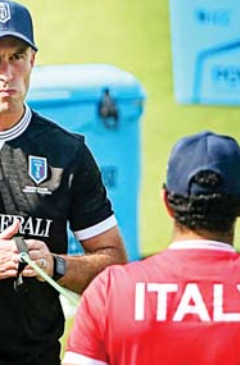
अभ्यास मैच और फिर तैयारी के लिए सीरीज में आयरलैंड को हराया जो आईसीसी के पूर्ण सदस्य पर उनकी पहली जीत थी। उन्होंने यूरोपियाई क्वालिफायर में स्काटलैंड को 12 रन से हराकर भी चौका दिया था, जो विश्व कप के लिए क्वालिफिकेशन पक्का करने में निर्णायक साबित हुईं। हालांकि बांग्लादेश को बाहर किए जाने के बाद शामिल हुई स्काटलैंड अब भी खतरे से सावधान है।