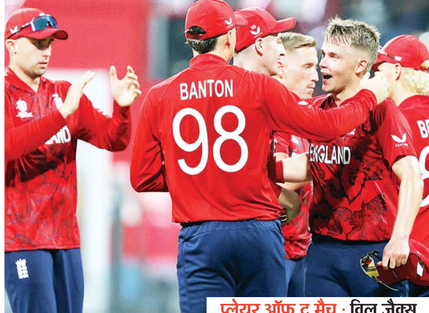
प्लेयर ऑफ द मैच : विल जैक्स