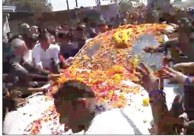
मानव कल्याण को समर्पित रहा। उनके अपूरणीय क्षति हुई है जिसकी भरपाई ब्रह्मलीन होने से आध्यात्मिक जगत को संभव नहीं।