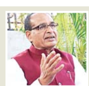
डील डिप्लोमेसी डेवलपमेंट और डिग्निटी का उत्तम उदाहरण

विशेष संवाददाता, भोपाल। केंद्रीय कृषि और किसान कल्याण मंत्री शिवराज सिंह चौहान ने कहा कि अमेरिकी ट्रेड डील से विपक्ष पूरी तरह से वॉटिलेटर पर आ गया है। अमेरिका के साथ हुई ट्रेड डील केवल एक व्यापारिक समझौता नहीं, बल्कि भारत की बढ़ती वैश्विक प्रतिष्ठा का प्रतीक है। भोपाल स्थित अपने निवास पर पत्रकारों से चर्चा करते हुए केंद्रीय मंत्री चौहान ने कहा कि ट्रेड डील से भारत को नई दिशा मिलेगी। यह दुनिया के लिए भी सुविधाएं देता है कि भारत की नीति कमिटेमेंट की है, कॉम्प्रोमाइज की नहीं। हम आत्मविश्वास के साथ देश के हित में निर्णय लेते हैं। भारत अंतरराष्ट्रीय मंच पर संतुलित और सकारात्मक रणनीति के साथ आगे बढ़ रहा है। चौहान ने कहा कि ये डील विपक्ष पूरी तरह से वॉटिलेटर पर आ चुका है।