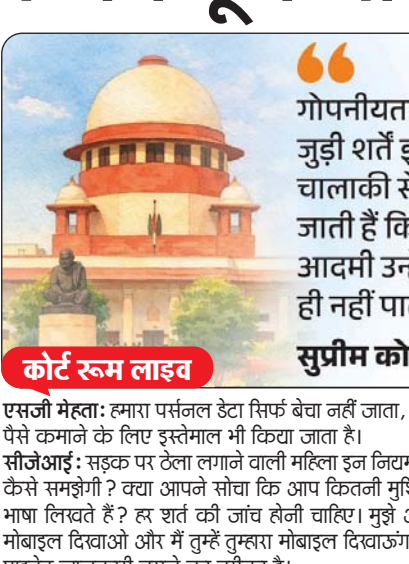
कोर्ट रूम लाइव