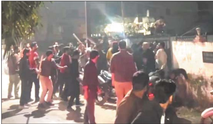
जीटी अवकाश को लेकर शुरू हुआ विवाद हुआ उग्र

लाठी डंडे से लैस छात्रों ने द्वारिका नगर में किराए के कमरे में रहने वाले फर्स्ट ईयर के छात्रों पर किया हमला