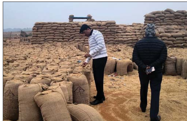
लापरवाही पर दिये सख्त निर्देश