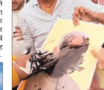
पोस्टर पर पोती कालिख