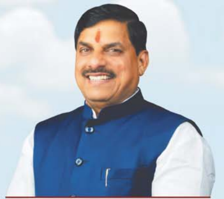
डॉ. मोहन यादव मुख्यमंत्री