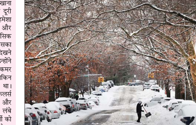
सोनमर्ग में लगातार हो रही भारी बर्फबारी के बीच भीषण एवलांच (हिमस्खलन) आया।

सोनमर्ग (गांदरबल), जेएनएन। जम्मू-कश्मीर के प्रसिद्ध पर्यटन स्थल सोनमर्ग में लगातार हो रही भारी बर्फबारी के बीच भीषण एवलांच (हिमस्खलन) आया। इस घटना में कई होटल और इमारतें बर्फ से ढंके गईं। राहत की बात यह है कि अब तक किसी के हताहत या घायल होने की सूचना नहीं है। पूरी घटना आसपास लगे सीसीटीवी कैमरों में रिकॉर्ड हो गई, जिसके वीडियो सोशल मीडिया पर तेजी से वायरल हो रहे हैं। अधिकारियों के अनुसार, यह हिमस्खलन मंगलवार रात मध्य कश्मीर के गांदरबल जिले में सोनमर्ग रिजॉर्ट क्षेत्र में हुआ। वीडियो फुटेज में देखा जा सकता है कि होटल के पीछे पहाड़ी से अचानक बर्फ का सैलाब नीचे की ओर आया और कुछ सेकंड में उसने होटलों व आसपास की इमारतों को अपनी चपेट में ले लिया। बर्फ के तेज गुबार से पूरा इलाका ढंके गया। घटना की जानकारी मिलते ही प्रशासन ने बचाव दलों को मौके पर