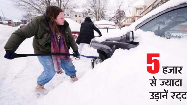
5 हजार से ज्यादा उड़ानें रद्द

वॉशिंगटन, जेएनएन। अमेरिका इन दिनों भीषण बर्फीले तूफान की चपेट में है। 23 जनवरी से शुरू हुए इस शक्तिशाली विन्टर स्टॉर्म ने देश के मध्य और पूर्वी हिस्सों में व्यापक तबाही मचाई है। अब तक कम से कम 38 लोगों की मौत की पुष्टि हो चुकी है, जबकि लाखों लोग कड़ाके की ठंड, बर्फबारी और बिजली की तूफान से जूझ रहे हैं। अधिकारियों ने मृतकों की संख्या बढ़ने की आशंका जताई है।