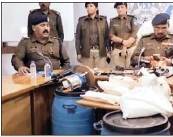
आगर मालवा पुलिस ने राजस्थान में ड्रग फैक्ट्री पर की कार्रवाई

एमडी-स्मैक समेत 5 करोड़ का माल जब्त, तीन गिरफ्तार, सरगना फरार