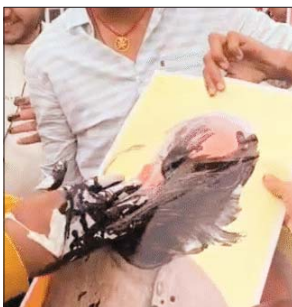
पोस्टर पर पोती कालिख