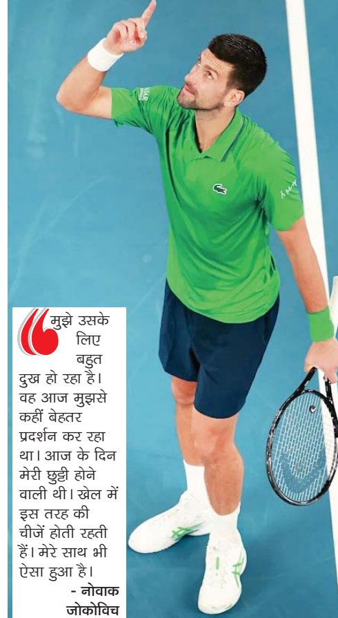
मुझे उसके लिए बहुत दुख हो रहा है। वह आज मुझसे कहीं बेहतर प्रदर्शन कर रहा था। आज के दिन मेरी छुट्टी होने वाली थी। खेल में इस तरह की चीजें होती रहती हैं। मेरे साथ भी ऐसा हुआ है। - नोवाक जोकोविच

सिनर ने एक अन्य मैच में अमेरिका के आठवीं वरीयता प्राप्त बेन शेल्टन को दो सेट 23 मिनट तक चले मैच में 6-3, 6-4, 6-4 से पराजित किया। वह लगातार तीसरी बार खिताब जीतने वाले खिलाड़ियों की सूची में शामिल होने से केवल दो जीत दूर हैं। जोकोविच दो बार यह कारनामा कर चुके हैं। सिनर को सेमीफाइनल में अधिक तरोताजा जोकोविच का सामना करना है, जिन्हें चौथे दौर में वॉकओवर मिला था। पुरुष वर्ग का अन्य सेमीफाइनल विश्व के नंबर एक खिलाड़ी कार्लोस अल्काराज वरीयता प्राप्त लॉरेन्सो मुसेटी चोट के कारण टूर्नामेंट से हट गए।