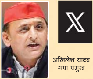
अशिलेश यादव सपा प्रमुख

भाजपा के दम ने अनादिकाल से चली आ रही सनातनी परंपरा को तोड़ दिया है। जगदगुरु शंकराचार्य का तीर्थराज प्रयाग की धरती पर माघ मेले को बिना पवित्र स्नान किये छोड़कर जाना अत्यंत अनिष्टकारी घटना है। संपूर्ण विश्व का सनातन समाज इससे आहत ही नहीं बल्कि अनिश्चित भय से आशंकित है।