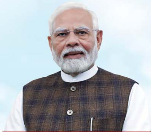
नरेंद्र मोदी प्रधानमंत्री