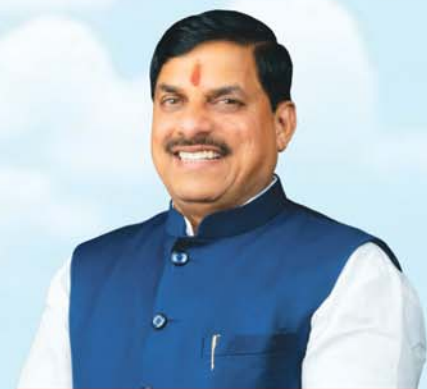
डॉ. मोहन यादव मुख्यमंत्री