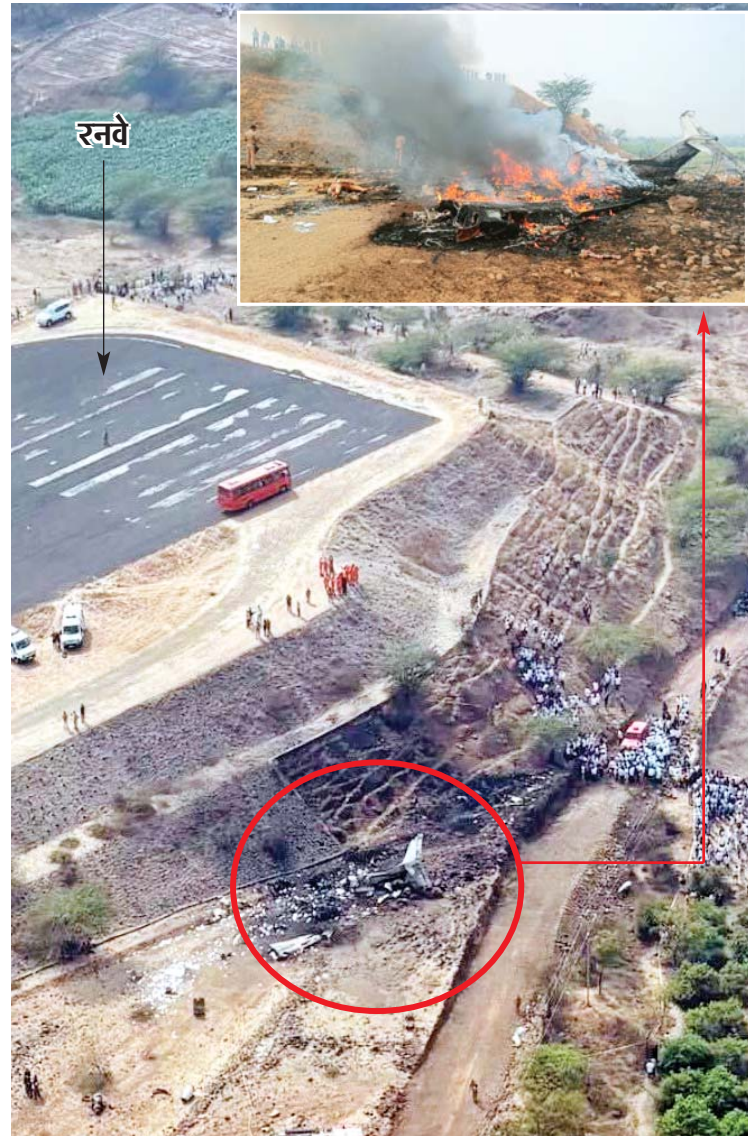
बुधवार को बारामती एयरपोर्ट से करीब 100 मीटर दूर (लाल घेरे में) विमान क्रैश हो गया। इसमें अजित पवार सहित पांच लोगों की मौत हो गई। (इनसेट) हादसे के बाद जलता विमान।

मुंबई, जेएनएन। ओह शिट-ओह शिट...! ये आखिरी शब्द थे उस विमान के को-पायलट के जो महाराष्ट्र के उप मुख्यमंत्री अजित पवार का विमान उड़ा रहे चालक दल में शामिल थे। बारामती में बुधवार सुबह कोहरा काफी अधिक था शायद इसलिए पायलट को रन-वे स्पष्ट दिखा नहीं और जब वह रन-वे के बगल में पहुंच गया उस क्षण सामने का दृश्य देखकर को-पायलट के मुंह से ओह शिट-ओह शिट के अलावा कुछ और नहीं निकल सका और विमान जमीन से टकराकर क्रैश हो गया।