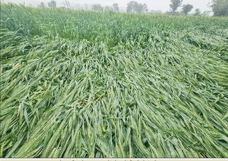
ओलावृष्टि से शाजापुर में खेत में बिछी गेहूं की फसल

विदिशा: फसल पर गिरे ओले, खेतों में भराया पानी