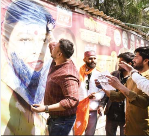
कांग्रेस ने भी किया प्रदर्शन