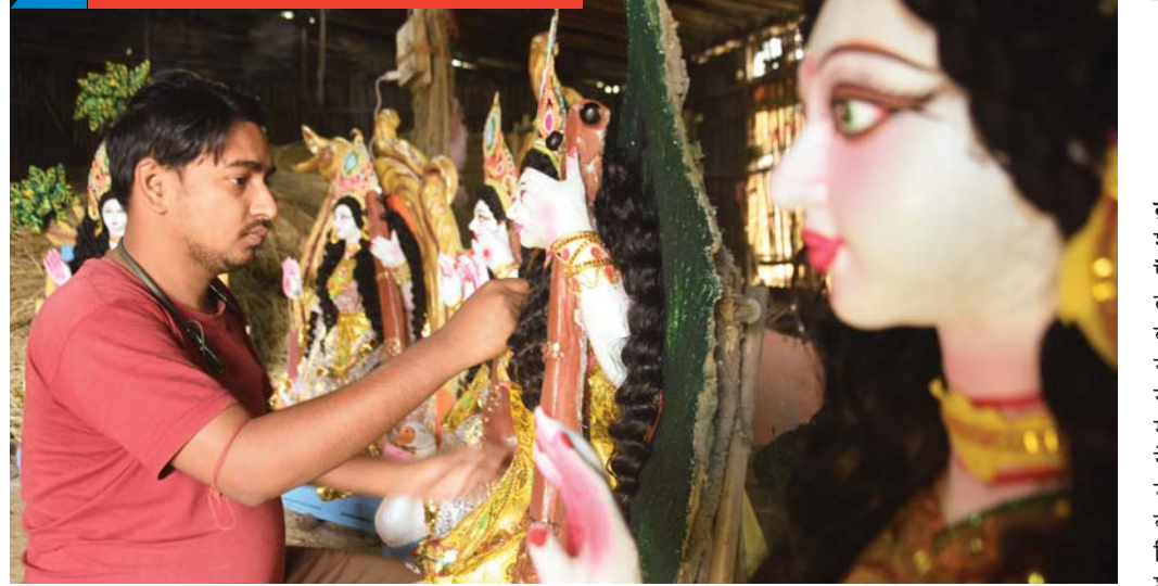
बसंत पंचमी पर 23 जनवरी को मां सरस्वती की पूजा की जाएगी, इसकी तैयारियां अंतिम दौर में चल रही हैं। हबीबगंज स्थित डीआरएम कार्यालय के पास कलाकार मूर्तियां तैयार करता हुआ।