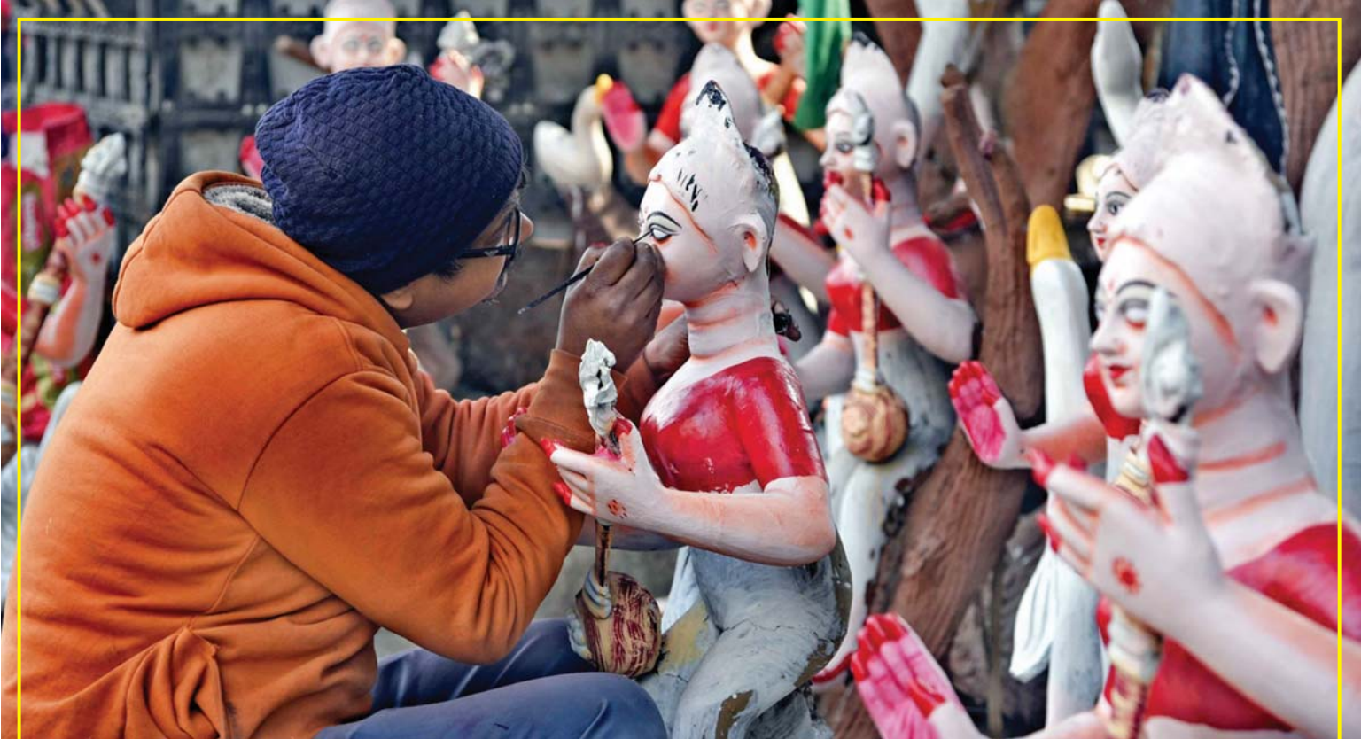
बसंत की आमद | देशभर में बसंत पंचमी और सरस्वती पूजा के लिए कलाकार व मूर्तिकार देवी सरस्वती की प्रतिमाओं को अंतिम रूप देने में जुटे हैं। रंगई-पुताई, स्प्रे और सजावट का काम तेज है, ताकि ज्ञान, संगीत और बुद्धि की देवी के स्वागत की तैयारियां पूरी हो सकें।

नई दिल्ली, जेएनएन। भारत ने पिछले कुछ दशकों में खाद्यान्न उत्पादन के मामले में बड़ी छलांग लगाई है। देश आज 140 करोड़ लोगों का पेट भरने के साथ-साथ अतिरिक्त अनाज उत्पादन कर निर्यात भी कर रहा है। सरकारी गोदामों में अनाज भरा है और 80 करोड़ लोगों को हर महीने मुफ्त राशन भी मिल रहा है। लेकिन इसके बावजूद एक सवाल बार-बार खड़ा होता है कि अगर पेट भर रहा है, तो कुपोषण 'निंदा' क्यों है? देश के प्रमुख आर्थिक थिंक टैंक आईसीआरआईआईआर (इंडियन काउंसिल फॉर रिसर्च ऑन इंटरनेशनल इकोनॉमिक रिलेशन्स) की एक रिपोर्ट ने इसी सवाल का जवाब देते हुए एक चौंकाने वाला खुलासा किया है। रिपोर्ट के अनुसार, भारत में कुपोषण की बढ़ी वजह अब भोजन की कमी नहीं, बल्कि भोजन की पोषण गुणवत्ता में गिरावट है। और इसके पीछे सबसे बड़ी समस्या है मिट्टी की बिगड़ती सेहत।