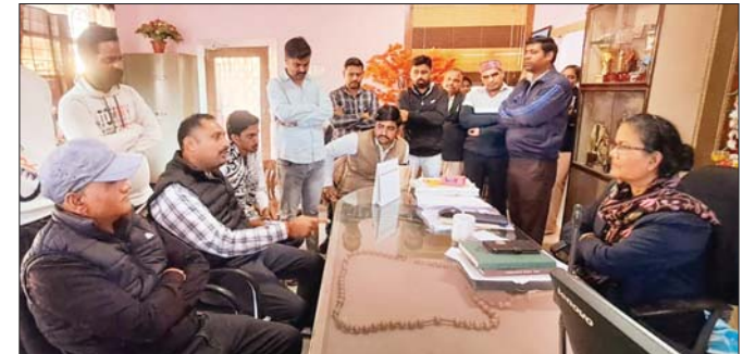
कहना था कि समोसे में फिनाईल जैसी महक आ रही थी, जिसके बाद उसे

सोनकच्छ। स्थानीय संत अंतोनी कान्वेंट स्कूल में बाहरी कैटीन की खाद्य सामग्री खाने से बच्चे बीमार हो गए, लेकिन स्कूल प्रशासन ने न तो बच्चों का उपचार कराया और ना ही अभिभावकों को सूचित किया। इस लापरवाही के खिलाफ अखिल भारतीय विद्यार्थी परिषद के कार्यकर्ताओं ने शनिवार को स्कूल परिसर में आंदोलन करते स्कूल प्रबंधन के खिलाफ जोरदार नारेबाजी की। गौरतलब है कि यह स्कूल मनमानी और अव्यवस्था को लेकर अक्सर समाचार पत्रों की सुर्खियों में रहता है, जो इस बार नियम विरुद्ध बाहरी कैटीन से सप्लाई की खाद्य सामग्री खाने से दो छात्र बीमार पड़ने को लेकर फिर बार सुर्खियों में आ गया है। घटना 13 जनवरी की है, जब स्कूल में परिसर से बाहर स्थित एक कैटीन संचालक द्वारा पोहे और समोसे बेचे, जिन्हें खाने के बाद स्कूल में पढ़ने वाले दो बच्चों की तबीयत खराब हो गई। एक बच्चे का