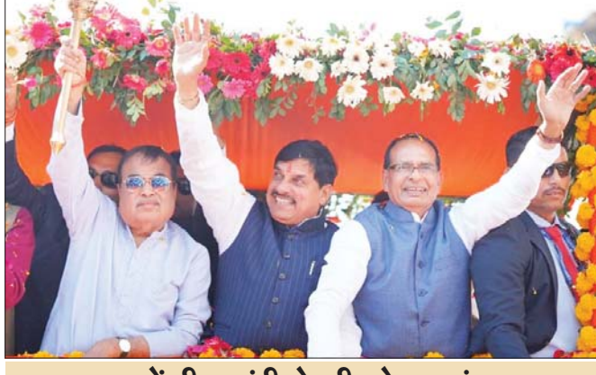
केंद्रीय मंत्री ने की घोषणाएं

क्या मोहन जी 2-4 करोड़ और मांग लेंगे: केंद्रीय मंत्री गडकरी ने कहा कि यहाँ आने पर सभी ने बहुत मांगें की है। सीएम डॉ. यादव, कृषि मंत्री