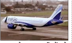
डीजीसीए ने इंडिगो को निर्देश दिया है कि वह इंटरनल जांच में तय अन्य जिम्मेदार अधिकारियों पर भी कार्रवाई करे और स्टेटस जल्द से जल्द सौंपे। डीजीसीए ने साफ किया है कि भविष्य में यात्रियों की सुरक्षा और सुविधा से किसी भी तरह का समझौता बर्दाश्त नहीं किया जाएगा। एयरलाइन को सही और व्यावहारिक तरीके से उड़ान संचालन, नियमों के पालन की पूरी तैयारी, बेहतर और जिम्मेदार प्रबंधन तय करना होगा।

नई दिल्ली, जेएनएन। डायरेक्टोरेट जनरल ऑफ सिविल एविएशन (डीजीसीए) ने एयरलाइन कंपनी इंडिगो पर 22.20 करोड़ का जुर्माना लगाया है। यह जुर्माना एयरक्राफ्ट रूलस, 1937 के रूल 133-ए के तहत लगाया गया है। इसके तहत एकमुश्त जुर्माना 1.80 करोड़ है। एफडीटीएल नियमों का 68 दिन तक पालन नहीं करने पर प्रतिदिन 30 लाख का जुर्माना लगाया गया, जो 20.40 करोड़ होता है। डीजीसीए ने यह एक्शन 3 से 5 दिसंबर, 2025 के बीच इंडिगो को 2507 फ्लाइट के कैंसिल होने और 1852 फ्लाइट के ऑपरेशन में देरी होने पर लिया है। इस कारण 3 लाख से ज्यादा यात्रियों को परेशानी हुई थी। नागरिक उड्डान मंत्रालय के निर्देश पर डीजीसीए ने इस मामले की जांच के लिए 4 मंबर वाली कमेटी का गठन किया था।