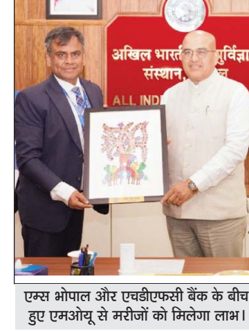
एम्स भोपाल और एचडीएफसी बैंक के बीच हुए एमओयू से मरीजों को मिलेगा लाभ।

द्वारा एम्स भोपाल को लगभग छह करोड़ रुपये मूल्य के अत्याधुनिक चिकित्सा उपकरण उपलब्ध कराए जाएंगे, जिनका उपयोग अंग प्रत्यारोपण कार्यक्रम को मजबूत करने और प्रत्यारोपण उत्कृष्टता केंद्र की स्थापना में किया जाएगा। इस सहयोग से एम्स भोपाल में उन्नत गंभीर देखभाल और सर्जरी से जुड़े उपकरणों की उपलब्धता सुनिश्चित होगी, जो जटिल अंग प्रत्यारोपण प्रक्रियाओं के लिए आवश्यक हैं। इससे संस्थान की अंग प्रत्यारोपण क्षमता में उल्लेखनीय वृद्धि होगी, रोगियों के उपचार परिणाम बेहतर होंगे और मरीजों को समय पर उच्च गुणवत्ता वाली चिकित्सा सेवाएं मिल सकेंगी। विशेष रूप से आर्थिक रूप से कमजोर वर्ग के मरीजों के लिए यह पहल अत्यंत लाभकारी सिद्ध होगी।