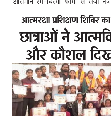
छात्राओं ने आत्मविश्वास और कौशल दिखाया।