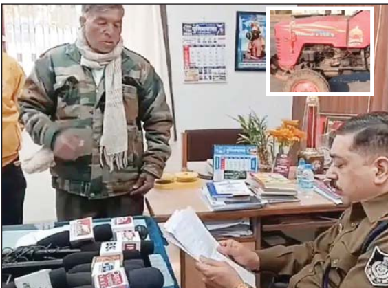
आरोपी ने अचानक किया फोन बंद

जागरण, जबलपुर। प्रदेश की संस्कारधानी जबलपुर में किसानों के साथ बड़ी टगी का मामला सामने आया है। शहर में निर्माणधीन रही रिंग रोड के नाम पर एक शख्स ने किसानों से किराये पर ट्रैक्टर लिये थे। किसानों का आरोप है कि ट्रैक्टर देने के बाद आरोपी ने न तो उसका किराया दिया और न ही वह अब किसानों के ट्रैक्टर लौटा रहा है। टगी का शिकार किसानों ने मंगलवार को पुलिस कप्तान के दफ्तर पहुंचकर कार्रवाई की गुहार लगाई। मालूम हो कि जबलपुर में सबसे बड़ी रिंग रोड बन रही है, जिसके लिए बड़ी-बड़ी मशीनों के साथ ट्रैक्टर भी किराये से लग रहे हैं। गौसलपुर, मंझौली, मड़गावां, कुंडम गांव में रहने वाले सैकड़ों किसानों ने जबलपुर के एक शख्स को किराए पर ट्रैक्टर दे दिए। तीन माह तक जब किराया नहीं मिला तो किसान मोता के पहुंचे। किसान व्यक्ति को ट्रैक्टर दिए थे वह गायब हैं। इतना ही नहीं 75 किसानों के ट्रैक्टर भी गायब हैं। किसानों ने