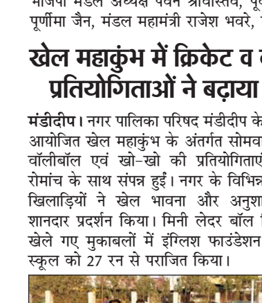
खेल महाकुंभ में क्रिकेट व वॉलीबॉल प्रतियोगिताओं ने बढ़ाया उत्साह।

मंडीदीप। नगर पालिका परिषद मंडीदीप के तत्वावधान में आयोजित खेल महाकुंभ के अंतर्गत सोमवार को क्रिकेट, वॉलीबॉल एवं खो-खो की प्रतियोगिताएं उत्साह और रोमांच के साथ संपन्न हुईं। नगर के विभिन्न विद्यालयों के खिलाड़ियों ने खेल भावना और अनुशासन के साथ शानदार प्रदर्शन किया। मिनी लेदर बॉल क्रिकेट वर्ग में खेले गए मुकाबलों में इंग्लिश फाउंडेशन ने द चाइल्ड स्कूल को 27 रन से पराजित किया।