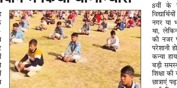
(कालीन) बिछाने की तो दूर की बात उनके लिए टाटपट्टी तक नहीं बिछाई गई, जिससे बच्चे ठंडी जगह खाली मैदान में ही सूर्य नमस्कार प्राणायाम करते हुए दिखाई दे रहे हैं। जब तस्वीरें सोशल मीडिया पर वायरल हुईं तो लोगों में इस बात की चर्चा हुई कि बच्चों के लिए कम-से-कम टाटपट्टी तो बिछाई जानी चाहिए थी। चर्चा है कि क्या करीब 40 करोड़ रुपए से बनने वाले इस संदीपनी (सीएम राइज) विद्यालय में इतनी भी व्यवस्था नहीं है।

बैरसिया। शासकीय सांदीपनि ठाकुर लाल सिंह विद्यालय बैरसिया में सोमवार को स्वामी विवेकानन्द के जन्मदिन युवा दिवस के अवसर पर साप्ताहिक सूर्य-नमस्कार कार्यक्रम का आयोजन किया गया। कार्यक्रम के दौरान की कुछ तस्वीरें सोशल मीडिया पर जमकर वायरल होने के बाद कार्यक्रम में अव्यवस्था की चारों तरफ खूब चर्चाएं हैं और इस पर जमकर सवाल खड़े हो रहे हैं। सोशल मीडिया पर वायरल वीडियो और तस्वीरों में देखा गया कि एक ओर मंच अथवा मंच के पास जनप्रतिनिधियों, अधिकारियों तथा शिक्षकों के लिए कारपेट (कालीन) बिछाया गया, जिस पर वह सूर्य नमस्कार और योगाभ्यास कर रहे थे। वहीं मंच के सामने मैदान में कतारों में बैठे सैकड़ों छात्रों को कारपेट