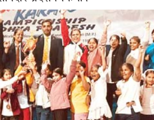
छात्राओं ने शानदार प्रदर्शन किया।