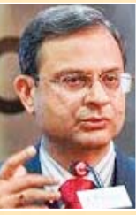
संजय मल्होत्रा आरबीआई गवर्नर

भारत की मजबूत धरोहर ग्रेड और इकोनॉमी की रेजिलिएंस विदेशी निवेशकों को लगातार आकर्षित करेगी। बैंकिंग, टेक्नोलॉजी और डॉटर इकोनॉमी में क्वालिटी इन्व्स्टमेंट्स का फल बन रहेगा। बैंकिंग, फाइनेंशियल सर्विसेज और टेक्नोलॉजी सेक्टर में हालिया बड़ी डीलस इस भरोसे को दिखाती हैं कि ग्लोबल निवेशक भारत को लॉन्ग टर्म ग्रोथ स्टोरी मान रहे हैं।