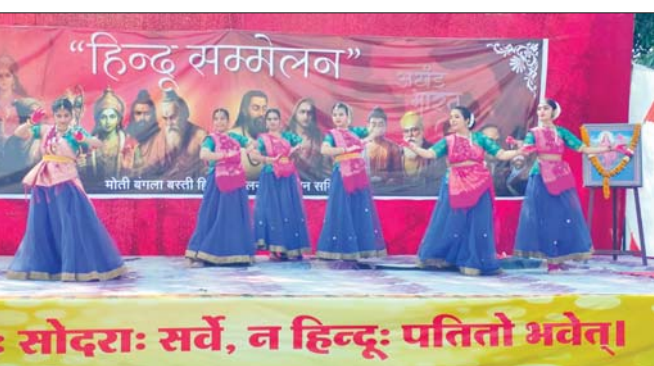
सौदरा: सर्वे, न हिन्दू: पतितो भवेत्।

भी मातृ शक्ति ने बड़-चढ़कर हिस्सा लिया। तत्पश्चात निर्धारित स्थान पर कार्यक्रम आयोजित किया गया, जहां पर मां सरस्वती व मां भारती के चित्र पर माल्यार्पण व दीप प्रज्वलित कर कार्यक्रम की शुरुआत की गई। अधिकांश मंचों पर सांस्कृतिक कार्यक्रमों की प्रस्तुति हुई। वहीं कुछ स्थानों पर बालक-बालिकाओं ने शस्त्र विद्या का भी प्रदर्शन किया, तो कहीं पर