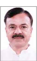
एवं राजमार्ग मंत्रालय द्वारा 1 जनवरी 2026 को जारी पत्र का उल्लेख करते हुए बताया कि इसके तहत जिला परिवहन कार्यालयों में वाहनों की मैनुअल फिटनेस प्रक्रिया को समाप्त कर केवल ऑटोमेटेड टेस्टिंग स्टेशन के माध्यम से फिटनेस परीक्षण किए जाने का प्रावधान किया गया है। परिवहन मंत्री ने कहा कि मध्यप्रदेश भौगोलिक दृष्टि से एक बड़ा राज्य है, जहां कई जिलों के बीच की दूरी 150 किलोमीटर से अधिक है। ऐसे में एटीएस विहीन जिलों के वाहन स्वामियों को फिटनेस परीक्षण के लिए दूसरे जिलों में वाहन ले जाना पड़ता है, जिससे समय अधिक लगता है और इंधन खर्च भी बढ़ता है। उन्होंने यह भी बताया कि यात्री वाहनों के परमिट निर्धारित मार्गों और

जागरण, भोपाल। मध्य प्रदेश के 55 जिलों में से सिर्फ 9 जिलों में वाहनों का फिटनेस ऑटोमेटेड टेस्टिंग स्टेशन (एटीएस) के माध्यम से हो रहा है। शेष 46 जिले ऐसे हैं, जहां एटीएस की सुविधा नहीं है। ऐसी स्थिति में वाहन मालिकों को फिटनेस के लिए परेशान होना पड़ रहा है। क्योंकि हाल ही में केंद्रीय सड़क परिवहन मंत्रालय ने एक सर्कुलर जारी किया है, जिसमें वाहनों का फिटनेस सिर्फ एटीएस के माध्यम से कराने का निर्देश दिया गया है। इस सर्कुलर के बाद मप्र के परिवहन विभाग के मंत्री राव उदय प्रताप सिंह ने केंद्रीय परिवहन मंत्री नितिन गडकरी से मुलाकात कर यह मांग रखी है कि जब तक प्रदेश के सभी जिलों में एटीएस की व्यवस्था नहीं हो जाती, तब तक वाहनों को फिटनेस व्यवस्था मैनुअली संचालित होने दी जाए।