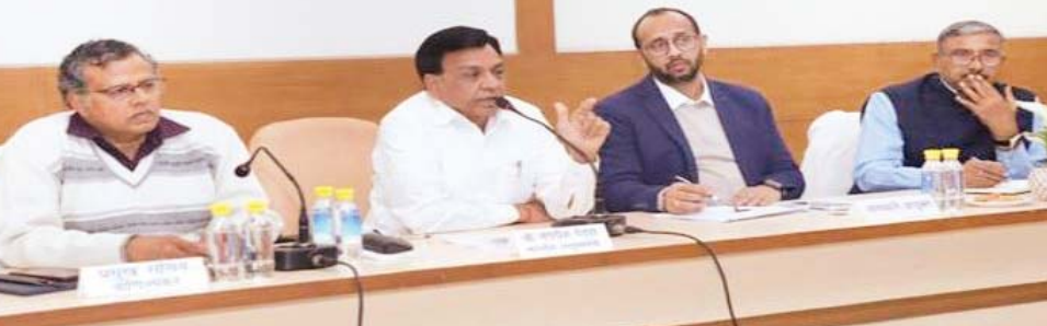
आबकारी नीति में बदलाव के लिए आए अहम सुझाव