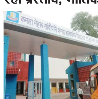
अपने क्षेत्रों में दो से तीन नये स्कूलों को स्थापित करने की मांग की है। विधायकों के पत्रों आधार पर कलेक्टरों से लगातार संवाद चल रहा है।

जागरण, भोपाल। स्कूल शिक्षा विभाग का सांदिपनि स्कूल खोलने का प्रथम चरण काफी सफल रहा है। इसे देखते हुए विभाग ने द्वितीय चरण में विधायकों की मांग पर करीब 250 नये सांदिपनि स्कूल खोलने की तैयारी में लग गया है। विभाग ने लगभग प्रस्ताव तैयार कर लिया है। इसलिए विभाग जिलों में मांग के मुताबिक जमीनों का भौतिक परीक्षण कर रहा है। जहां नये स्कूलों की नींव रखी जाएगी। इसके लिए विभाग कलेक्टर और स्थानीय जनप्रतिनिधियों से लगातार संपर्क में बना हुआ है। अधिकारियों का कहना है कि मौजूदा सत्र के पहले ही प्रस्ताव तैयार कर शासन को भेजा जाएगा। दूसरे चरण में भी करीब ढाई सौ सांदिपनि स्कूल खोले जाएंगे। हर जिले से विधायकों ने अपने-