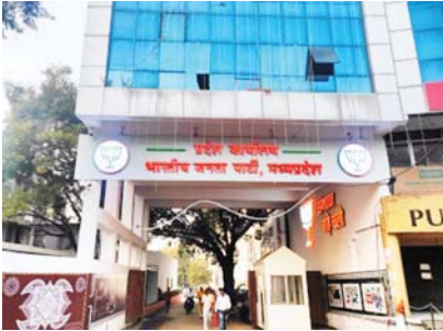
भरोसे वाली जिम्मेदारी इन नेताओं के पास