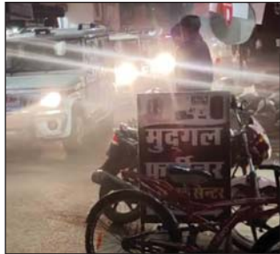
सेमरिया नगर परिषद अध्यक्ष व जियं वार्ड 16 के उपचुनाव के लिए होगा मतदान