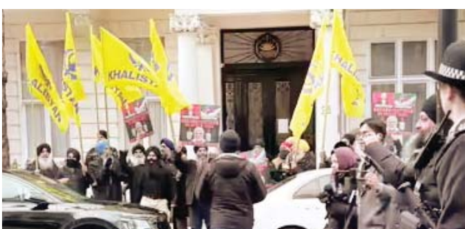
लंदन में भारतीयों के प्रदर्शन में खालिस्तानियों का हुड़दंग