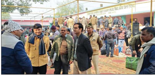
रायपुर कर्चु.में सरपंच पद के लिये होगा मतदान