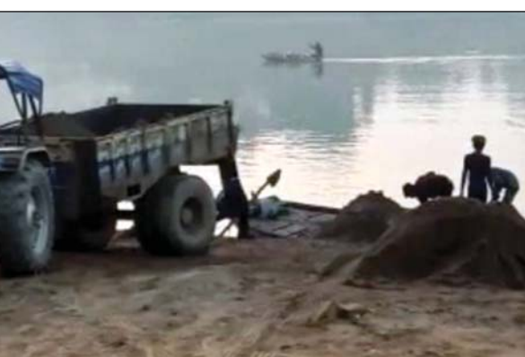
भी अवैध खनन एवं परिवहन का कार्य जारी है। जिला कलेक्टर एवं पुलिस अधीक्षक का ध्यान आकृष्ट कराते हुए अवैध खनन एवं परिवहन पर कठोरता पूर्वक रोक लगाए जाने की मांग की गई है।

है। इससे पहले बोली लगती थी और शासन के खाते में राजस्व की राशि जमा होती थी। टमस नदी से रेत निकाली की निविदाएं होती थीं जो लाखों रुपए में बोली जाती थीं लेकिन प्रशासनिक लचर व्यवस्था के चलते निविदाएं नहीं बुलाई जाती जिसके कारण अवैध रूप से रेत निकाली का कार्य किया जाता है। एसडीएम, एसडीओपी ,तहसीलदार टीआई, सहित पूरा प्रशासन मौजूद रहता है फिर भी अवैध खनन एवं परिवहन बेधड़क जारी है। जवा मुख्यालय में एसडीएम, तहसीलदार,नायब तहसीलदार सहित चार थानों में टीआई स्तर के अधिकारी पदस्थ हैं इसके बावजूद