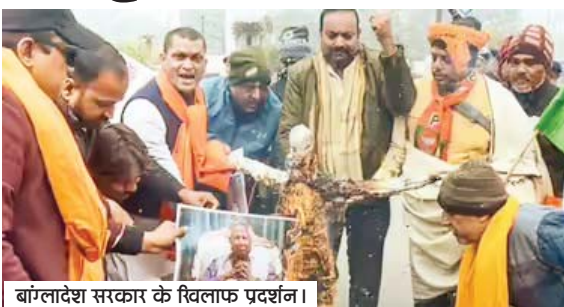
बांग्लादेश सरकार के विलापक प्रदर्शन।