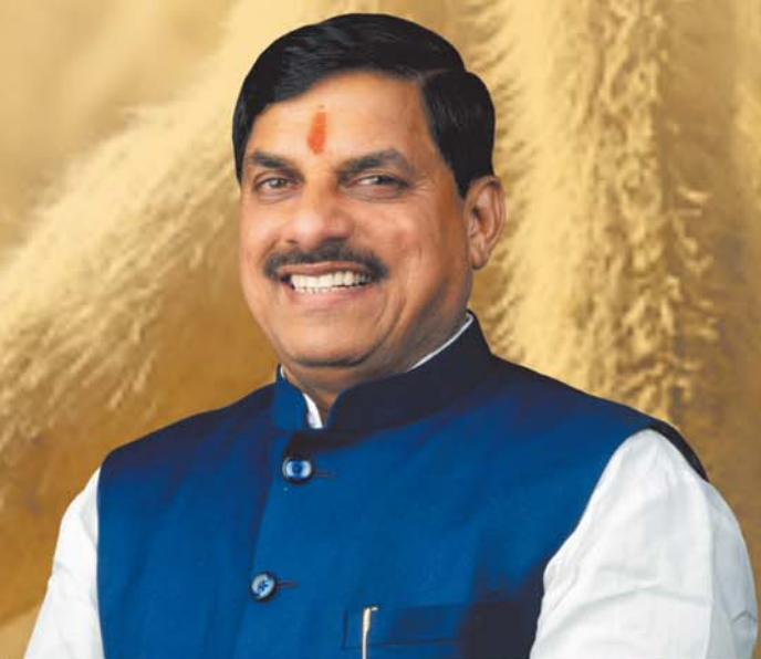
डॉ. मोहन यादव, मुख्यमंत्री