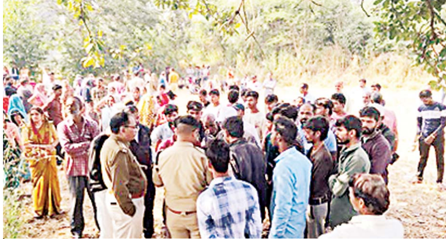
लाश मिलने के बाद मौके पर जुटी गांव वालों की भीड़