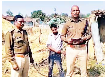
पुलिस गिरफ्त में आरोपी जेठ