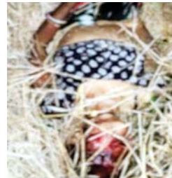
खेत में पड़ा मृतका का शव