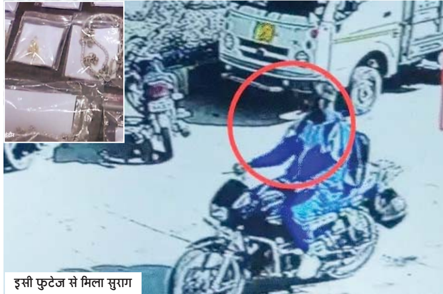
इसी फुटेज से मिला सुराग

महाराष्ट्र के वर्धा क्षेत्र में एक घटना ने उसे 'तलवार सिंह' बना दिया। फेमस होने की चाहत में उसने एक