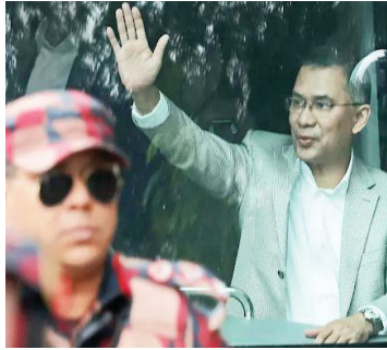
लेकर एक शब्द भी नहीं कहा। इसके बाद तारिक ने एवरकेयर अस्पताल में अपनी मां से मुलाकात की।

बांग्लादेश की पूर्व प्रधानमंत्री खालिदा जिया के बेटे तारिक रहमान 17 साल बाद देश लौट आए हैं। वे गिरफ्तारी से बचने के लिए 2008 में लंदन भाग गए थे। तब हसीना सरकार में उनके खिलाफ भ्रष्टाचार के कई मामले चल रहे थे। गुरुवार को तारिक के स्वागत में उनकी पार्टी बीएनपी के 1 लाख से ज्यादा कार्यकर्ता जुटे। ढाका एयरपोर्ट से लेकर 300 फीट रोड तक रोड शो किया। इस 13 किलोमीटर के रास्ते को कवर करने में उन्हें 3 घंटे का समय लगा। तारिक ने 17 मिनट भाषण दिया। इस दौरान उन्होंने कहा, हम देश में शांति कायम करेंगे और नया बांग्लादेश बनाएंगे। हालांकि उन्होंने शेख हसीना को शाहिदुल इस्लाम से जबरन वसुली की रकम मांगी थी। 24 दिसंबर की रात अमृत और उसके साथी शाहिदुल के घर घेरे लेने गए थे। जब घरवालों ने चोर-चोर चिल्लाकर शोर मचाया तो स्थानीय लोग मौके पर पहुंचे और अमृत की पीटाई कर दी। उसके अन्य साथी भागने में सफल रहे, जबकि सलीम हथियारों के साथ पकड़ा गया।