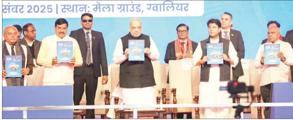
अटल बिहारी वाजपेयी की 101वीं जयंती पर आयोजित 'अभ्युदय मध्यप्रदेश ग्रोथ समित' में केंद्रीय गृहमंत्री शाह, विधानसभा अध्यक्ष तोमर, मुख्यमंत्री मोहन यादव, केंद्रीय मंत्री सिंधिया और भाजपा प्रदेश अध्यक्ष खडेलवाल ने निवेश पुस्तिका का विमोचन किया।

अभ्युदय ग्रोथ समित में शाह ने निवेशकों को मंच से ही सौंपे जमीन...ज 7 पर