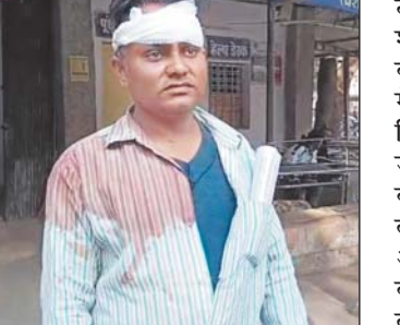
थाने में दर्ज कराई गई। दरअसल मामला जिले के गोविंदगढ़ थाना क्षेत्र

जागरण, रीवा। एक परिवार में आयोजित बरसी कार्यक्रम के दौरान युवक पर कुल्हाड़ी से हमला कर दिया गया। हमलावर कोई और नहीं बल्कि घायल का चाचा और चचेरा भाई था, जो बरसी में निमंत्रण ना देने से नाराज थे। आरोपियों द्वारा कुल्हाड़ी से किए गए हमले में घायल युवक को उपचार के लिए संजय गांधी अस्पताल में भर्ती कराया गया है और घटना की शिकायत