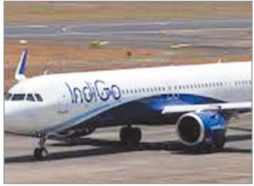
उप मुख्यमंत्री एवं नगरीय विकास और आवास मंत्री की उपस्थिति में होगा शुभारंभ