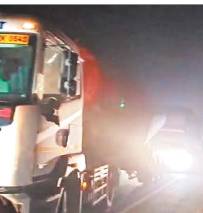
मऊगंज बाटपास पर गुंडागर्दी का तांडव, आरोपियों के हौसेले बुलंद