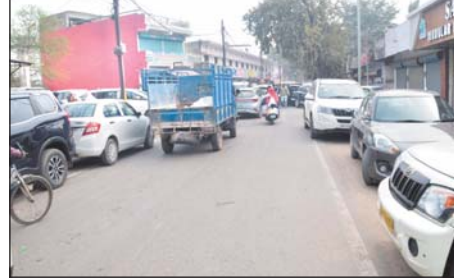
जागरण, रीवा। शहर के बिछिया क्षेत्र में रविवार को जाम लगा रहा, जाम लगने से निकलने वाले वाहनों के चके थम गए, वाहन चालक हॉर्न बजाते रहे, किन्तु यहाँ व्यवस्था देखने वाला कोई नहीं था। यहाँ फंसे वाहन चालक आवागमन सुचारु करने में सहयोग की बजाय अपने वाहन लेकर घुसे चले आ रहे थे। कुछ वाहन चालकों ने ही पहल करते हुए किनारे फंसे वाहनों को हटवाया और आवागमन सुचारु करवाया। शहर की मुख्य सड़कों सहित विभिन्न चौराहे में दिनभर में अनेकों बार जाम लगना आम बात हो गई है। कुछ सड़कों को छोड़ दें तो बाकी की सड़कें काफी चौड़ी हैं, इसके बाद भी शहरवासियों को जाम का सामना करना पड़ रहा है। अधिकतर वाहन चालक अपनी साइड से वाहन न चलकर राँग साइड ही चलते हैं, बाएँ ओर से

मुख्य चौराहे सहित भीड़ भरी सड़कों में रोज की समस्या