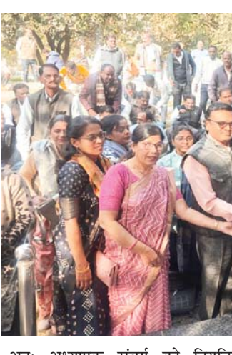
अतः अध्यापक संघ की नियुक्ति दिनांक से वरिष्ठता का लाभ दिया जाये।