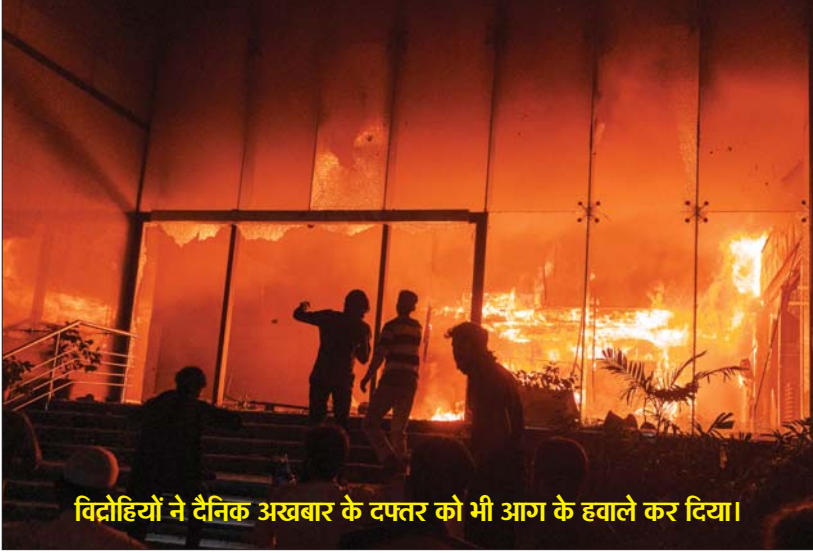
विद्रोहियों ने दैनिक अखबार के दफ्तर को भी आग के हवाले कर दिया।