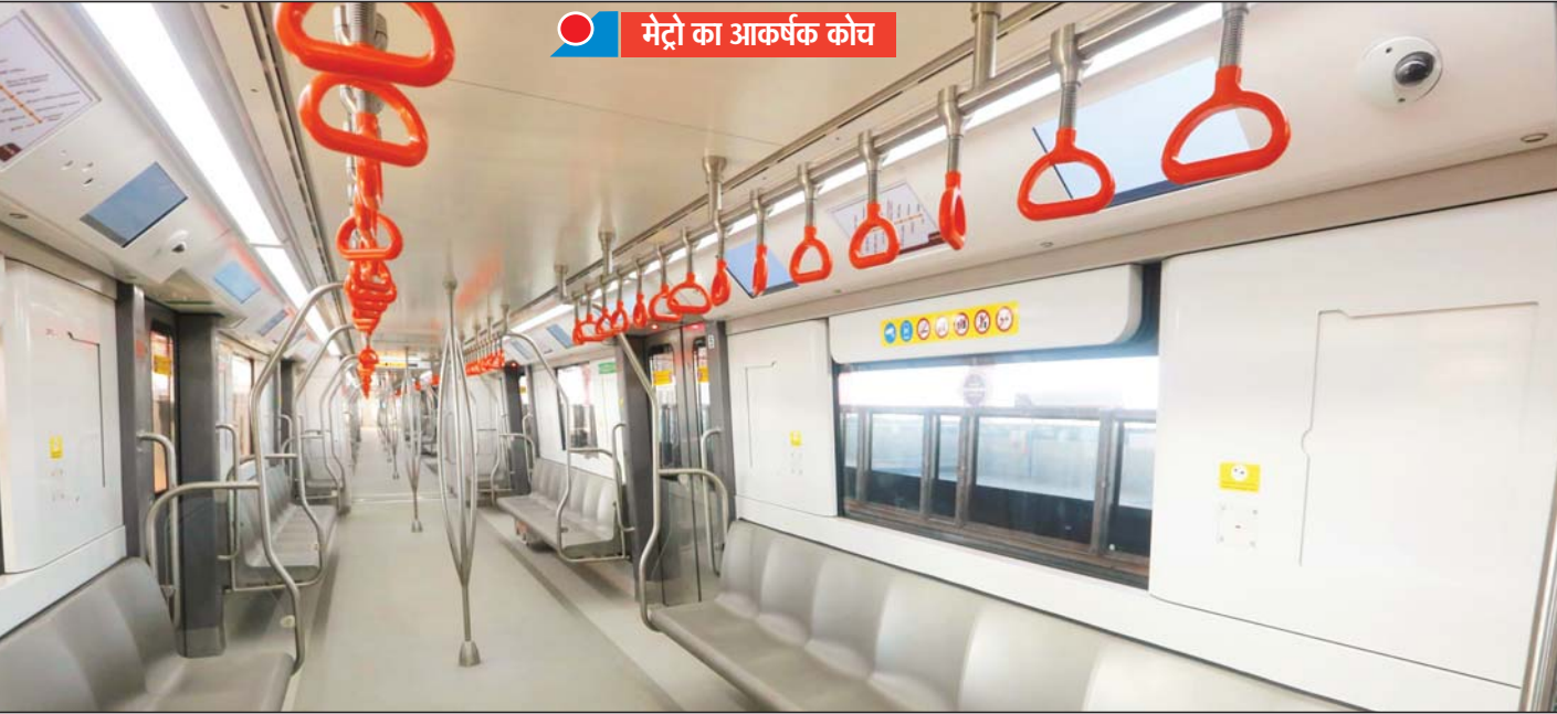
मेट्रो का आकर्षक कोच