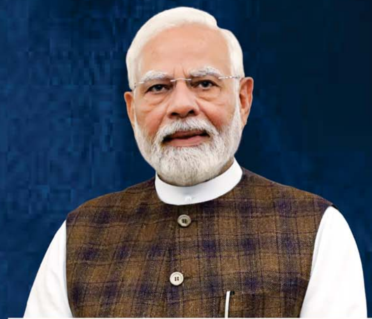
नरेन्द्र मोदी, प्रधानमंत्री