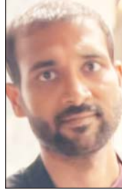
अयोध्या नगर का मामला

जागरण, भोपाल। अयोध्या नगर थाना क्षेत्र में एक कारोबारी ने ऑनलाइन गेम में करीब 30 लाख रुपए हारने के बाद फांसी लगाकर सुसाइड कर लिया।