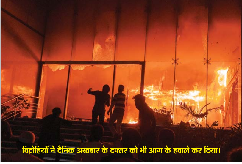
विद्रोहियों ने दैनिक अखबार के दफ्तर को भी आग के हवाले कर दिया।