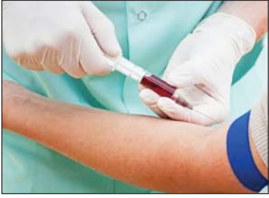
जाए और इन क्षेत्रों में निजी ब्लड बैंक से कांटेक्ट कर ब्लड की जरूरत को पूरा किया जाए।