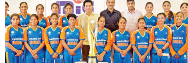
सचिन ने टी-20 विश्व कप विजेता भारतीय महिला दृष्टिबाधित टीम से मुलाकात की।

मुंबई, जेएनएन। महान बल्लेबाज सचिन तेंदुलकर ने टी-20 विश्व कप जीतने वाली भारतीय महिला दृष्टिबाधित क्रिकेट टीम से मुलाकात की और चुनौतियों से पार पाने तथा देश का नाम रोशन करने के उनके जल्द की तारीफ की। पूर्व भारतीय क्रिकेटर और भारतीय महिला दृष्टिबाधित क्रिकेट टीम के बीच यह मुलाकात मंगलवार को एमआईजी क्रिकेट क्लब में हुई। आयोजकों ने एक बयान में कहा, दिग्गज खिलाड़ी (तेंदुलकर) ने टीम को याद दिलाया कि सफलता अपने साथ बड़ी जिम्मेदारी भी लाती है।