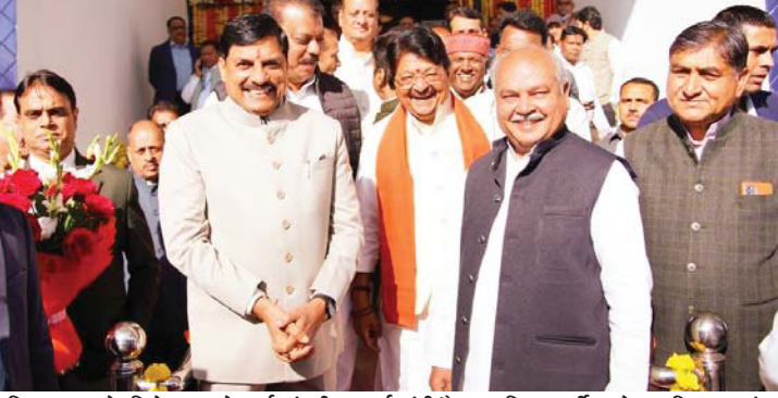
विधानसभा के विशेष सत्र के पूर्व संसदीय कार्य मंत्री कैलाश विजयवर्गीय, नेता प्रतिपक्ष उमंग सिंघार और विधानसभा अध्यक्ष नरेंद्र सिंह तोमर के साथ मुख्यमंत्री डॉ. मोहन यादव।

मुख्यमंत्री ने कहा कि प्रधानमंत्री नरेन्द्र मोदी और केंद्रीय गृह मंत्री अमित शाह के नेतृत्व में हमने 11 दिसंबर को नक्सलवाद के लाल सलाम को आखिरी सलाम किया है। यह विधानसभा के लिए भी गौरव का विषय है, क्योंकि वर्ष 1999 में काँग्रेस पक्ष