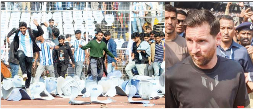
आयोजक गिरफ्तार, जांच के लिए बनाई गई उच्चस्तरीय समिति

कोलकाता, जेएनएन। महान फुटबॉलर लियोनल मैसी के भारत दौरे का कोलकाता पड़ाव अख्यवस्था और नाराजगी की भेंट चढ़ गया। शनिवार को सांठ लोक स्टेडियम में मैसी, उरुग्वे के स्ट्राइकर लुईस सुआरेज और अर्जेन्टीना के मिडफील्डर रोड्रिगो डी पॉल फैंस से मिलने पहुंचे। तीनों महज 22 मिनट में ही स्टेडियम से निकल गए। इससे नाराज दर्शकों ने स्टैंड से कुर्सियां और बोलतें फेंकनी शुरू कर दीं, मैदान पर लगे टेंट उखाड़ दिए और कुछ जगहों पर अफरा-तफरी मच गई। एक फैन के घायल होने की भी सूचना है। कार्यक्रम के लिए 12 हजार रुपये तक के टिकट लेकर पहुंचे कई दर्शकों का आरोप है कि मैसी सामने ठीक से आए ही नहीं। एक फैन ने कहा, 'मैसी के आसपास सिर्फ नेता व सेलिब्रिटी थे। हमें बुलाया क्यों गया? हमने पैसे दिए, पर चेहरा भी नहीं देख पाए।' नाराजगी का बड़ा कारण यही रहा कि जिस इंटरव्यू और समय की उम्मीद थी, वह नहीं मिला।