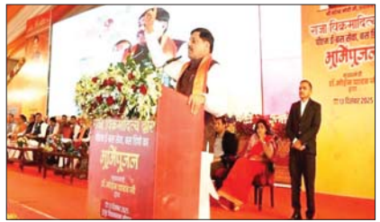
सामाजिक समरसता पर जोर

जागरण, भोपाल। अपने चिकित्सक पुत्र का विवाह सामूहिक सम्मेलन में कर देश-प्रदेश के लोगों के लिए आदर्श प्रस्तुत करने वाले मुख्यमंत्री डॉ मोहन यादव ने प्रदेशवासियों से शादी और मृत्युभोज के कार्यक्रमों में फिजूलखर्ची न करने का आह्वान किया है। मुख्यमंत्री डॉ. यादव ने कहा कि इस तरह की फिजूलखर्ची बंद होना चाहिए। ऐसे कार्यक्रमों पर दिखावा करने की बजाय बच्चों को पढ़ाना महत्वपूर्ण है। हर परिवार को धन की बचत कर बच्चों को पढ़ाई पर खर्च करना चाहिए। साथ ही उन्होंने सामाजिक समरसता के लिए प्रयास करने का भी आह्वान किया। मुख्यमंत्री ने प्रदेश सरकार के 2 वर्ष पूर्ण होने पर शनिवार को भोपाल-सीहोर मार्ग पर फंडा स्थित महाराणा प्रताप शासकीय उच्चतर माध्यमिक विद्यालय में आयोजित कार्यक्रम में यह आह्वान किया। कार्यक्रम में भोपाल-इंदौर पर मार्ग पर सम्राट विक्रमादित्य स्वागत द्वार के निर्माण के लिए भूमिपूजन भी किया गया। सीएम ने कहा कि यह अद्भुत संयोग है कि एक तरफ भोपाल में भव्य विक्रमादित्य द्वार का भूमिपूजन कर हम प्रदेश की विरासत संजोने का प्रयास कर रहे हैं। वहीं शहर को स्वच्छ, सुलभ और प्रदूषण रहित परिवहन सेवा देने के लिए पीएम ई-बस सेवा योजनांतर्गत अत्याधुनिक ई-बस डिपो का भूमिपूजन हो रहा है।